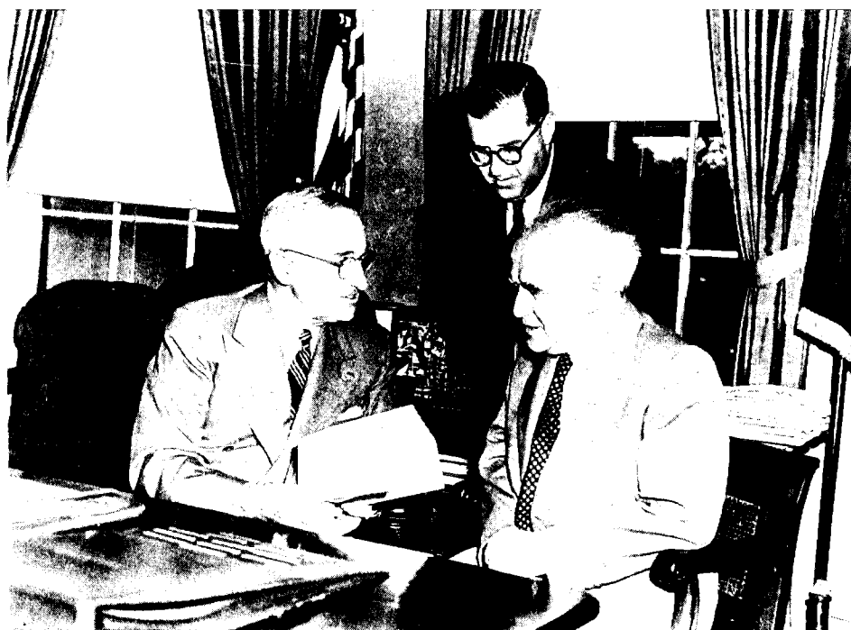
פגישה עם נשיא ארצות-הברית, הרי טרומן

לכיוון השני. כך, למשל, הסביר ראש הממשלה הישראלי בראשית 1950 למנהיג יהודי אמריקאי שביקר אז בארץ, מדוע למרות האווירה האנטי-קומוניסטית בווינגטון ועל-אף חוסר הנחת המסוים שם מהמדיניות הגלובלית של ישראל (אשר גרם מצוקה כלשהי ליהודי אותה מדינה), נותרו שלוש מערכות-שיקולים נגד שינוי קיצוני בה. 37 הנימוק הראשון, שהטריד את בן-גוריון גם זמן רב לאחר-מכן, היה חוסר הבהירות לגבי תכניתיה הצבאיות של ארצות-הברית במזרח-התיכון — 'האם תלחם אמריקה על המזרח הקרוב או תפקיר אותו לנפשו? בכל אופן לא תשלח הנה אמריקה כוח צבאי גדול להגן אך ורק עלינו'. במצב כזה אין זה מפתיע, שהתקשרות אסטרטגית עם המערב נתפשה כטומנת סיכונים רבים. הנימוק השני, שגם הוא המשיך להשפיע זמן רב לאחר-מכן, היה קשור לנושאי עלייה: 'כל מבטחנו הוא בעליה. רומניה סגורה אבל לא נוכל לותר בקלות על מאות אלפי יהודים. יש עוד עלייה מפולין צ'כיה בולגריה. אם יש איזה סיכוי שהוא להביא יהודים מהמזרח וביחוד רומניה — אסור לנו להפקיר אותם'. ולבסוף הציג בן-גוריון שיקול, שנהג לגלות אז בצורה ברורה בעיקר ליהודים ולא לדיפלומטים זרים. היתה זו עדיין בריטניה, ולא ארצות-הברית, ששיחקה תפקיד מכריע בעיצוב המדיניות הבינלאומית במזרח-התיכון. בן-גוריון נרתע מקשירת גורלה של ישראל במדינה זו.