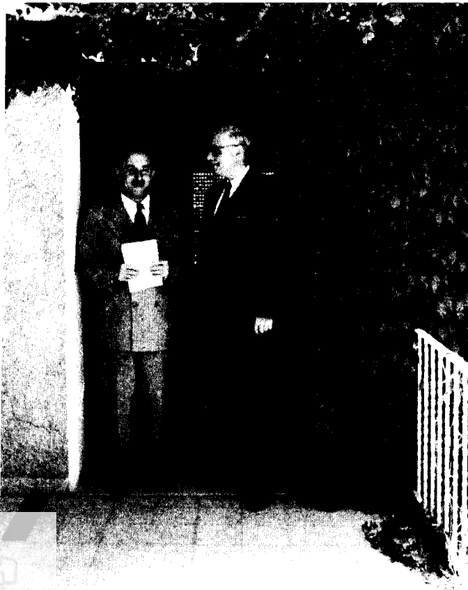
משה שרת ואדוארד גיון (Guyon), הנציג המיוחד של צרפת בישראל שהועלה מאוחר יותר לדרגת שגריר, הקריה, תל- אביב, יולי 1949

קיבלה דחיפה גדולה. אחת מפעולותיה של מחלקה זו באותו זמן היתה עריכת סקירה לבדיקת התייחסויותיו המילוליות של בן-גוריון לברית-המועצות במהלך תקופת פעילותו בהנהגה המדינית של היישוב, ככל הנראה כדי לדעת במה יוכלו אויבי המדינה שבדרך להיאחזו על-מנת לטרפד את ההתקרבות האפשרית בין שני הצדדים. בסיכום הסקירה הועלתה המסקנה בלשון המעטה, כי 'הרבה חיבה יתרה לברית המועצות לא תמצא בכל אלה'. 13