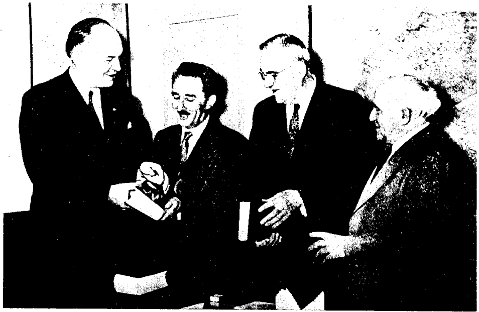
ביקורם בישראל של ג'ון פוסטר דאלס, מזכיר המדינה לענייני חוץ של ארצות-הברית והרולד סטאסן, מנהל הסוכנות לבטחון הדדי, 1953

לעשות את כל ההכנות לקראת כל צרה שלא תבוא. גם אנחנו נוכל להיות לעזר הרי שיש לעשות את מה שניתן לעשות על ידי שנינו יחד. 64 חודש לאחר-מכן הבהיר בן-גוריון לוועדה המדינית של מפא"י מה כוונתו בהכנות אלה ושוב, כמו בשלהי 1950, המוקד היה חזוקה של ישראל ורתיעה ממחויבויות חוזיות מצידה: אין לדבר על בסיסים לאנגליה כי היא לא תגן עלינו ותעזור לערבים. ואשר לאמריקה יש להסביר שישראל כולה — מחוזקת במובן צבאי ואינדוסטריאלי היא הבסיס ויש לדאוג לשיפור דרכי התחבורה... להגדיל כוח יצורנו לציד ולאמן צבאנו. זה יעמוד לעולם החופשי ביום פקודה. 65