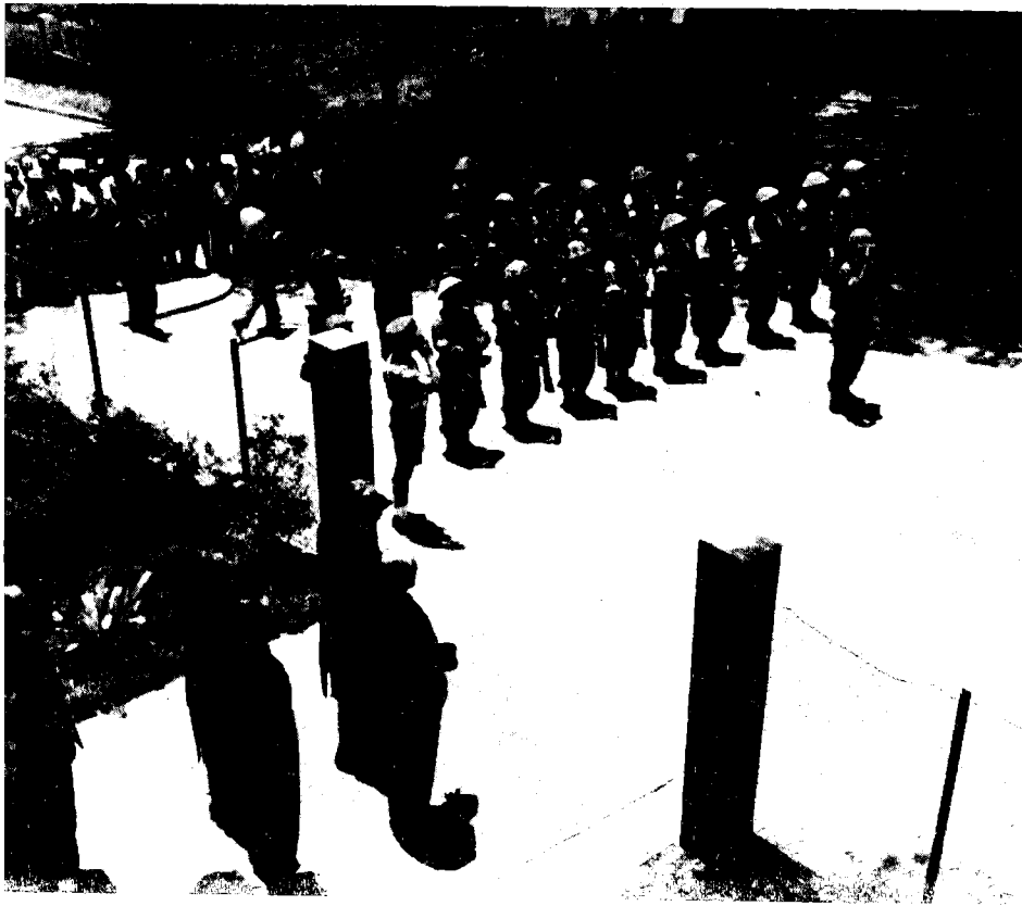
טקס הגשת כתב-האמנה של השגריר הראשון של בריטניה בישראל, אלכסנדר נוקס הלם, בקריה בתל-אביב, 27 במאי 1949