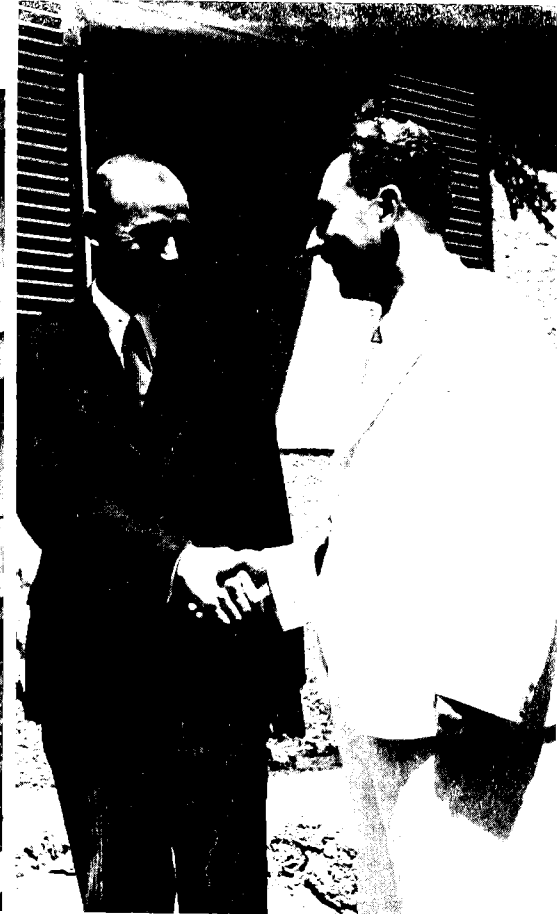
משמאל: דגלי ארצות-הברית וברית-המועצות מתנוססים זה ליד זה על גג מלון 'גת-רימון', בו שכנו שגרירי שתי המעצמות (מקדונלד וירשוב), תל-אביב 1949. מימין: משה שרת והציר הראשון של ברית-המועצות, פבל ירשוב, ספטמבר 1948

בפני צמרת משרדי החוץ והבטחון בארץ את הקו הבריטי כלפי ישראל כעוין לחלוטין בנימוק, כי 'לא קריפס [שר האוצר הבריטי], לא מוריסון [סגן ראש ממשלת בריטניה] ולא באוואן [שר הבריאות הבריטי] מנהלים מדיניות חוץ [בריטית] אלא בוין וזו מדיניות איבה'. 22 לפי דעתו, השינויים הפרסונליים בצמרת הבריטית לא יצרו שינויים בתוכן הקונספציה האנטי-ישראלית, ושנתיים מאוחר יותר קבע בפני הוועדה המדינית של מפלגתו, כי 'אידן ממשיך במדיניות של בוין'. 23 הדימוי של המשך הקו העוין מצד הבריטים הודגש בראשית נובמבר של אותה שנה, כאשר בן-גוריון קבע ממקום גלותו הפוליטית בשדה-בוקר במכתב לשרת, אז ראש ממשלת ישראל, כי 'המנטליות [הבריטית] של ועידת לונדון משנת 1938 עומדת בתוקפה ללא שינוי כלשהו. כך דיברו מלקולם (מקדונלד) והליפקס. הם בלי ספק משקפים עמדת אנטוני [אידן]'. 24 תחושה זו הועברה בלשון המעטה לשליח הנשיא האמריקאי, אשר ניסה לתווך בין מצרים וישראל בראשית 1956.