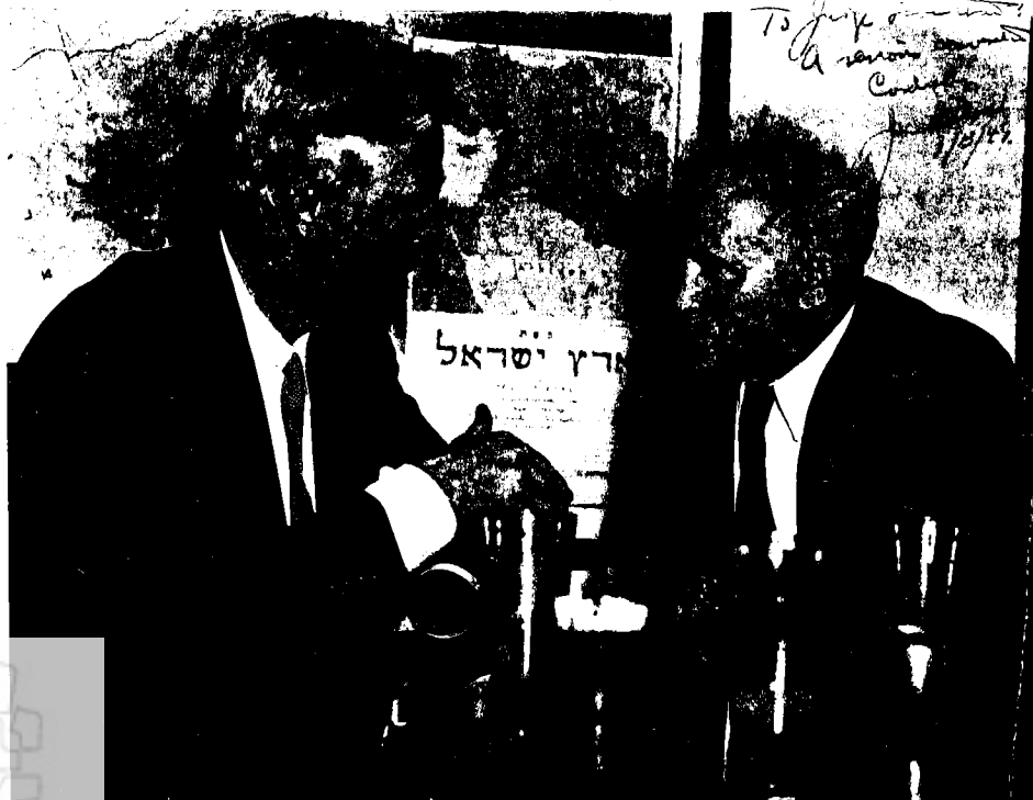
בן-גוריון ופרופ' גיימס מקדונלד, השגריר הראשון של ארצות הברית, 1949

כאשר נשאל על-ידי בן שיחו על הדעה של השמאל בנושא, השיב לו בן-גוריון בסודיות, כי 'הישראלים יתמכו בניפרץ כל צורה של שיתוף פעולה קומוניסטי במקרה של קונפליקט עולמי'. מעבר לכך הבטיח המנהיג הישראלי, כי 'אם תתקיף רוסיה את שדות התעופה האסטרטגיים של ישראל יוכל צבא הגנה לישראל להחזיק מעמד עד אשר יגיעו הכוחות האמריקאים והבריטים'. בדיווחו של השגריר האמריקאי צוין לכן, כי 'ראש הממשלה לא יכול היה להיות מפורש יותר ברצונו לחייב את ישראל ללא כל הסתייגות למערב'. אין ספק, כי האיתות הזה של בן-גוריון, ביטא מהפכה בתפישתו והיה בעל השפעה שקשה להגזים בחשיבותה לגבי ההתפתחות של האוריינטציה הבינלאומית של ישראל; מאז היה בן-גוריון נכון מעשית לזהות את ישראל אסטרטגית וצבאית עם המערב, כנגד ברית-המועצות. בקבלת החלטה זו היה ככל הנראה בודד, ועובדה זו היתה מספיק חשובה לו עצמו כדי להעבירה בצורה עקיפה לידיעת המימשל האמריקאי כמה שבועות לאחר פגישתו עם השגריר של מדינה זו בתל-אביב. לא ברור אם ניסה להעביר החלטה דוקטרינרית בממשלה ונכשל, או שחשש לעשות זאת בסוף יולי וראשית אוגוסט. אך ברור לחלוטין, שהחשש מקרע חמור בהסתדרות, שהטריד ביותר כמה מראשי מפלגתו בהקשר של החלטות אוריינטציוניות פרר-מערביות, לא היה לו אז השפעה משמעותית על בן-גוריון. מכל מקום, הקו שנקט בסוף יולי, שעיקרו העברת מסר למערב, ובעיקר לארצות-הברית כי 'למרות שבתקופת שלום אנו מנסים לשמור על עצמאות מדינית, בזמן מלחמה [גלובלית] נעמוד במאה