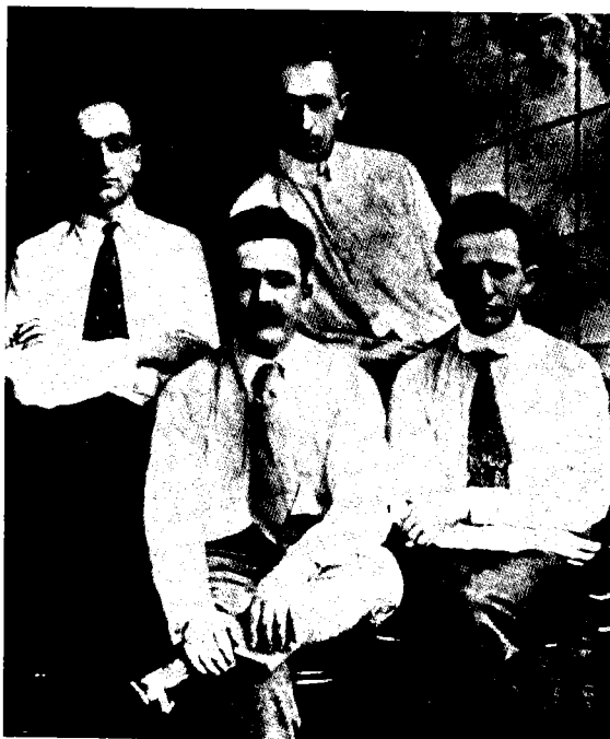
ארץ-ישראלים בניו-יורק, 1916. יושבים (מימין לשמאל): דוד בן-גוריון, יעקב זרובבל; עומדים: יצחק בן-צבי ושמואל בונצ'יק