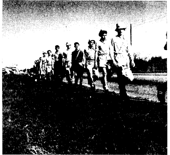
מימין: אימוני גרני"ע (1948). משמאל: יומה הראשון של היאחזות עין-עדיאן (יטבתה), 30 באוקטובר 1951

הקיבוץ והביע לא אחת ובחריפות רבה את אכזבתו מכשלונם של הקיבוצים בקליטת עלייה. 24 המבחן החלוצי של בן-גוריון היה בראש וראשונה מבחן ההיענות לצורכי ההתיישבות, הפיתוח וקליטת העלייה, ולא מבחן הגשמתה של אוטופיה חברתית שלמה. זו היתה עמדתו לגבי הוויכוח ההיסטורי בין הקיבוץ ובין המושב בשנות העשרים, 25 וזו נשארה גם עמדתו לגבי מבחן של צורות ההתיישבות בתקופת המדינה.