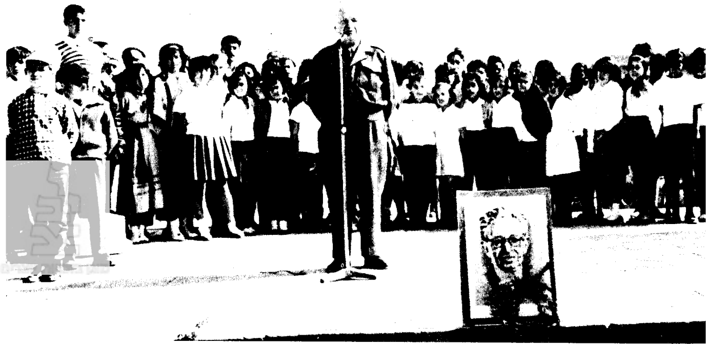
בן-גוריון נואם בפני ילדי ירוחם

יהודים שונים ויהודים שונים שובנו את ארץ מצאן