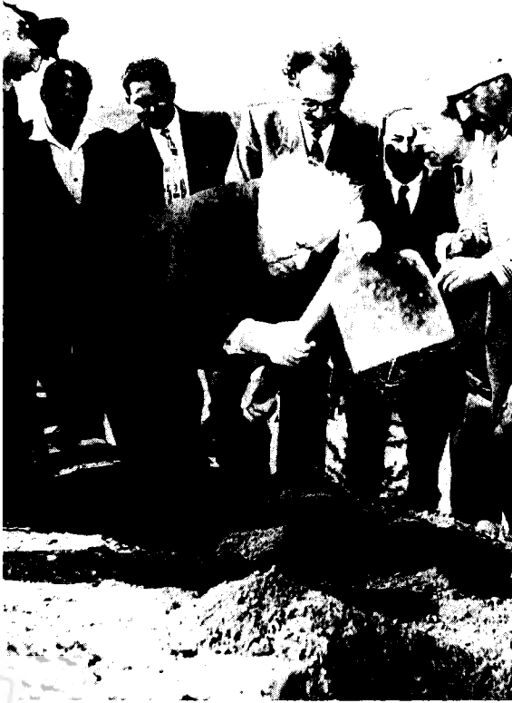
בן-גוריון נוטע ארז ביער-ירושלים (1958)

לתנ"ך. הספר שנולד על רקע היסטורי של עצמאות ומולדת וסביבה בין לאומית מסוימת — העם שוב לא היה מסוגל לראותו ולהבינו ככנתנינו המקורית. 5