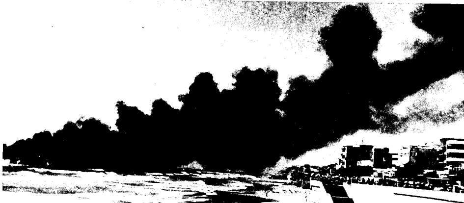
'אלטלנה' עולה באש (יוני 1948)