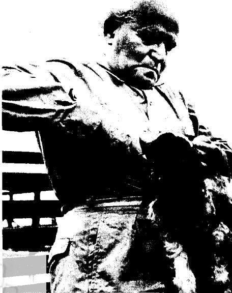
בן-גוריון בשדה-בוקר (דצמבר 1954)

התפיסה הממלכתית מהווה אפוא מרכיב מרכזי והכרחי במורשת ההיסטורית והאידיאולוגית של בן-גוריון. היא ניזונה מאמונתו והשקפתו הציונית, מתפיסתו הביקורתית של ההיסטוריה היהודית בארץ-ישראל ובגלות, מן ההסתייגות מדרך התפתחותה של המערכת הפוליטית היישובית, מתפיסת המדינה המודרנית והעקרונות הדרושים לקיומה ותיפקודה הנאות, ואפשר שגם מן המסורת הסוציאליסטית המהפכנית.