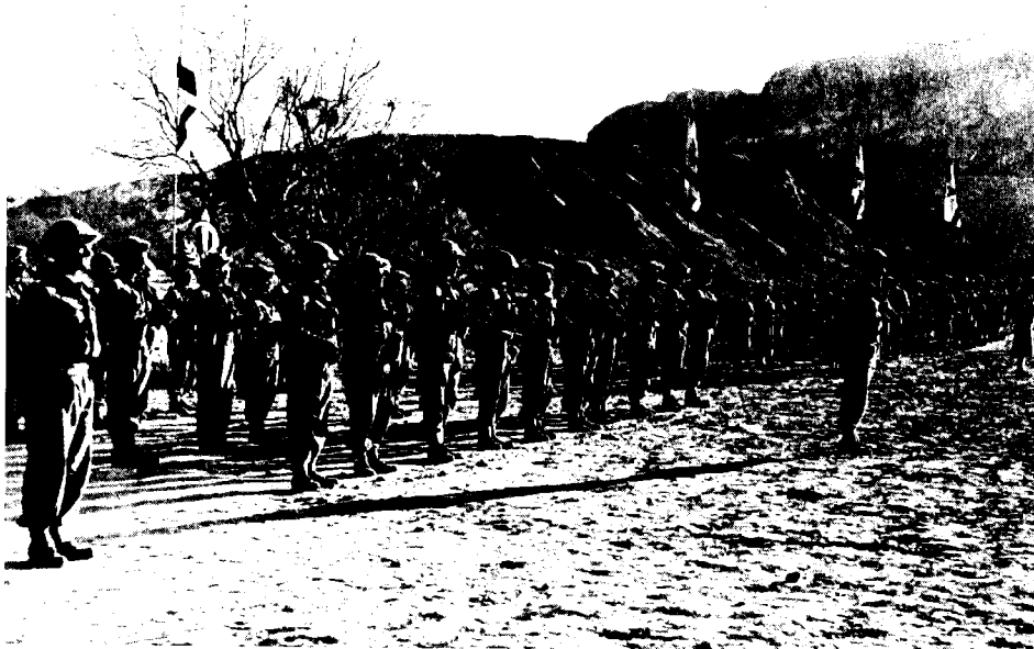
היאחזות נח"ל ג' בעין-גדי (1953)

יכולת זה — אין לנו עוד צורך במאמצים החלוציים שהושקעו בקבוצה ובמושב, בשתי הצורות העיקריות של ההתיישבות העובדת החלוצית. מעכשיו תעשה הכל המדינה, בכוח מנגנונה, חוקיה, תקציבה, פקודותיה, שלטונה. ואכן גדול ונכבד הכלי הזה — מאין כמוהו. לא ישור אליו, לא ההסתדרות הציונית ולא הסתדרות העובדים; שני הכלים הגדולים אשר מהם בא לנו כמעט כל המעשה שנעשה בארץ במשך חמישים השנים האחרונות מחוץ למה שעשו היוזמה וההון הפרטי — ולא מעט עשו גם הם. יכולתה ואפשרויותיה של המדינה עולות על יכולתם ואפשרויותיהם של כל המכשירים והכלים הציבוריים אשר היו לנו עד היום הזה. מה שעשתה המדינה בזמן קצר בשטח הקרקע, לא עשו חובבי ציון, הקרן הקיימת, הברון, פיק"א וההון הפרטי במשך שבעים שנה. צבא ההגנה לישראל גאל בזמן קצר פי עשרה ויותר מהשטח שנגאל לפניו במשך שלושה דורות. גם בשטח העליה עשתה המדינה בשנה אחת, יותר מאשר עשינו קודם לכן בעשר שנים או גם בחמש עשרה שנה. אולם אין טעות מזיקה ומסוכנת מההנחה, שעם הקמת המדינה עברה שעתה של החלוציות. ההפך הוא הנכון. רק בתוך המדינה יש שכר וסיכוי רב למפעל החלוצי. יש דברים שיעשו בכוח המדינה ובכוחה בלבד: פתיחת שערי הארץ לרווחה לכל יהודי הרוצה לחזור למולדתו, מתן חינוך יסודי לכל ילד וילדה בישראל, שרותי בריאות וכדומה. אולם גם העליה והחינוך והקליטה לא יעשו בלי התאזרות חלוצית ובלי צורות חיים חלוציות. 27