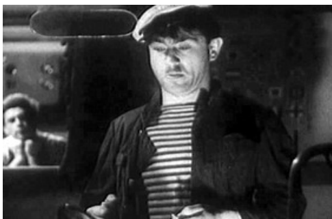
Ефим Геллер в фильме «Танкер «Дербент»