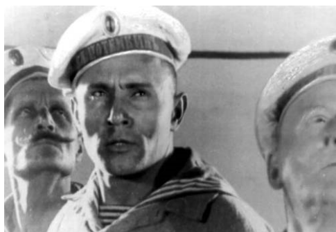
Кадры из фильма С. Эйзенштейна «Броненосец «Потемкин» (1925 г.)