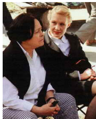
Кира Муратова и Рената Литвинова

В 67-ом на Одесской киностудии снимается фильм Станислава Говорухина «Вертикаль» с песнями Владимира Высоцкого. В том же году он сыграл здесь свою первую главную роль в кино — у Киры Муратовой в «Коротких встречах». В 79-ом пиком актерской карьеры Высоцкого стал фильм «Место встречи изменить нельзя». В музее Одесской киностудии сегодня одни из самых дорогих экспонатов — плащ и шляпа Глеба Жеглова. В 70–80-х годах по количеству выпущенных фильмов одесситы в первой тройке ведущих киностудий страны. И каких фильмов!!! В 78-ом Георгий Юнгвальд-Хилькевич снимает «Д’Артаньян и три мушкетера» — картина сразу становится советским блокбастером. В 79-ом вместе с «Местом встречи...» на экраны выходят «Приключения Электроника» режиссера Константина Бромберга. Он же в 82-ом снимает новогодний мюзикл «Чародеи», и опять ошеломляющий успех.