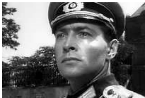
Тихонов в роли разведчика в фильме «Жажда»