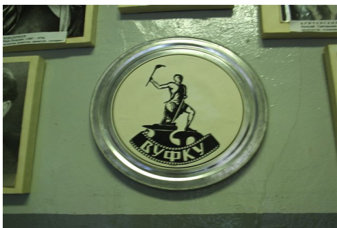
Старая эмблема Одесской киностудии

Немногие знают, что кинематограф родился именно в Одессе. Летом 1893 года, одесский инженер Иосиф Андреевич Тимченко, механик-самоучка Новороссийского (Одесского) университета при участии одесского инженера М. Фрейденберга изобрел и построил первый в мире съемочный аппарат, которым были сняты две ленты — «Скачущий всадник» и «Копьёметатель». 7 ноября (ст. стиль) 1893 года газета «Одесский листок» напечатала объявление о том, что в фойе гостиницы «Франция» (угол Дерибасовской и Колодезного переулков) «открылась художественная выставка живых фотографий, которые приводятся в движение с помощью электрической машины». Первые проекция на экран осуществлялась с помощью того же аппарата с присоединением к нему «свечи Яблочкова», дугового осветительного прибора. Демонстрация двух лент с большим успехом длилась до 20 декабря 1893 года. А 9 января 1894 года в Москве, на шестом заседании секции физики 9 съезда российских естествоиспытателей и врачей аппарат Тимченко с механизмом перерывчатого движения ленты и с проекцией на экран был показан участникам заседания. Смотрели «Скачущего всадника» и «Копьёметателя». В протоколе заседания сказано, что состоялся факт публичной демонстрации профессором Любимовым «снаряда для анализа стробоскопических явлений»,