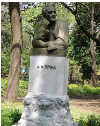
Памятник А. Бучме на территории киностудии