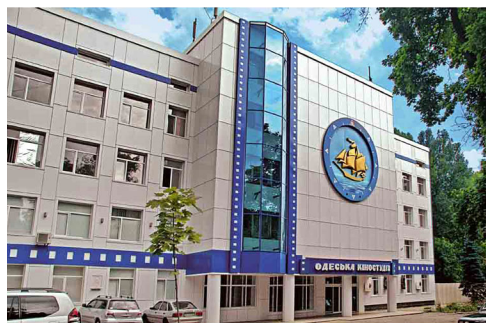
Фасад Одесской киностудии