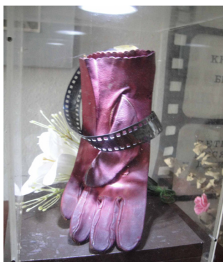
Перчатка Веры Холодной, подаренная дочерью актрисы