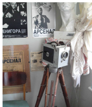
Съемочный аппарат А. Довженко