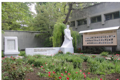
Памятник Погибшим кинематографистам, которые в 1941-м пошли в ополчение