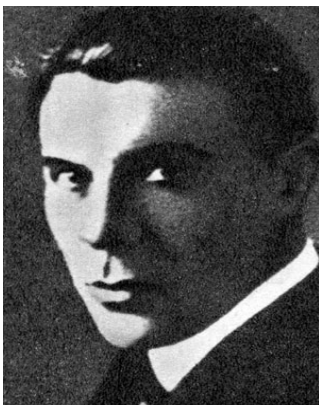
Петр Чардынин, актер, оператор, режиссер