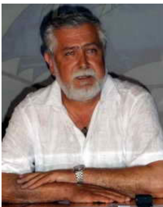
Ярослав Луний, кинорежиссер