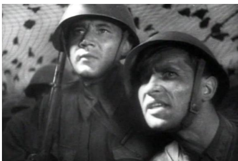
Борис Андреев и Марк Бернес в фильме «Два бойца»