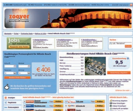
Die Bewertungsportale holidaycheck.de und zoover.de konnten im Test überzeugen