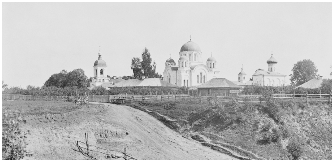
Спасо-евфросиниевский монастырь. Фото 1911-1912 гг.