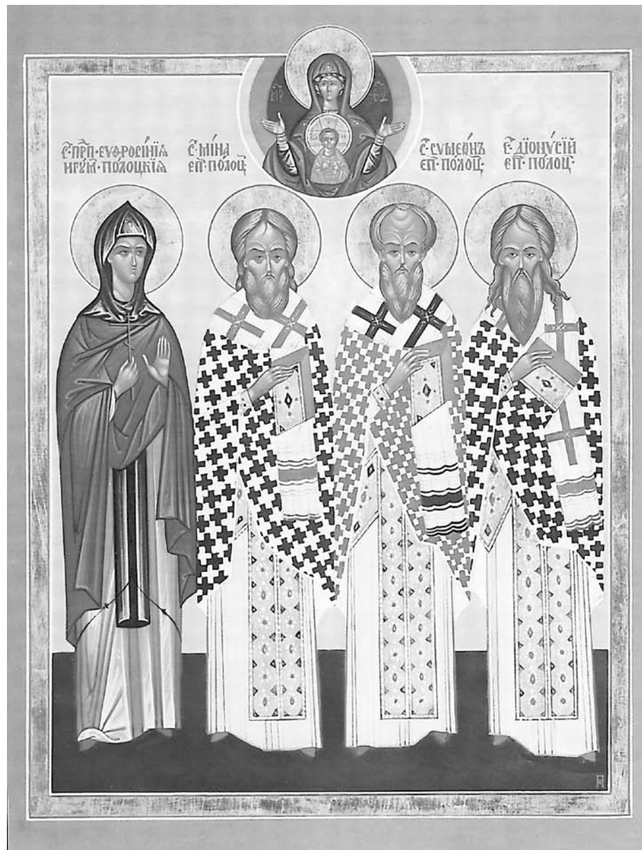
Святые угодники Полоцкой земли, 2010 год.

Выписка из фотоальбома «Храмы и монастыри Полоцкой епархии».