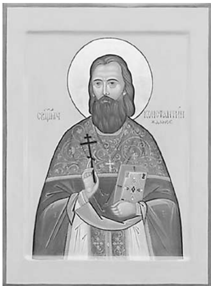
Священномученик Константин, пресвитер Шарковщинский (1919) был прославлен в лике святых угодников 4 июня 2011 года.

В Полоцкой епархии пять местночтимых святых угодников: преподобная Евфросиния, игуменья и княжна Полоцкая (1173), память 23 мая (ст.ст.)/5 (н.ст.) июня; святитель Мина, епископ Полоцкий (1116), память 20 июня (ст.ст.)/ 3 июля (н.ст.); святитель Дионисий, епископ Полоцкий (1182), память 23 июня (ст.ст.)/ 6 июля (н.ст.); Святитель Симеон, епископ Полоцкий (1289), память 3 (ст.ст.) / 16 февраля (н.ст.); священномученик Константин, пресвитер Шарковщинский (1919), память 16 (ст.ст.)/29 (н.ст.) апреля.