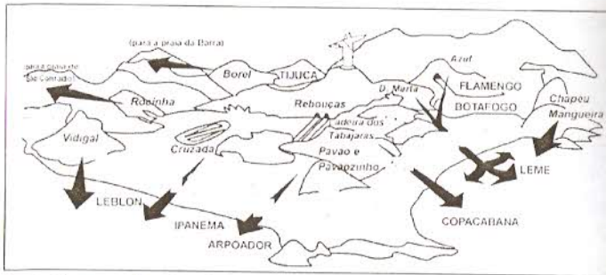
Praias frequentadas pelos funkeiros.

Caso tomemos como exemplo duas zonas liminares do contato da Cidade do Rio de Janeiro em 1994 – os concorridos bailes de comunidade (quando ainda não tinham sido interditados) que ocorriam nos morros encravados na “zona nobre” do Rio e as praias da Zona Sul –, apesar do clima de histeria freqüentemente reinante na mídia e das eventuais situações de tensão e conflito (como nos arrastões), a observação dessas áreas naquele ano atesta uma interação entre diferentes segmentos e grupos sociais. Além da “invasão” tão condenada das praias da Zona Sul nos fins de semana pelos funkeiros, ocorria também, nesses mesmos fins de semana, uma “invasão” no sentido inverso, na direção de alguns morros da cidade, como pode ser constatado nos dois mapas a seguir.