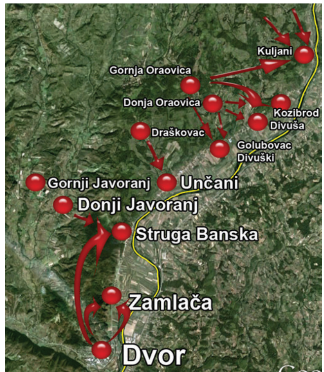
Karta napada na Strugu Bansku 26. srpnja 1991.

Usprkos obećanju pripadnika JNA da će zaštititi ranjene Hrvate civile i pripadnike MUP-a RH otpremljene u Dom zdravlja u Dvoru, to obećanje nisu izvršili te su pripadnici tzv. SUP-a SAO Krajine izveli iz stacionara Doma zdravlja ranjenog Milu Pušića i ubili ga. Iz stacionara je izveden i ranjeni civil Mile Mikičić i zajedno s ranjenim civilom iz živog štita Mijom Bartolovićem