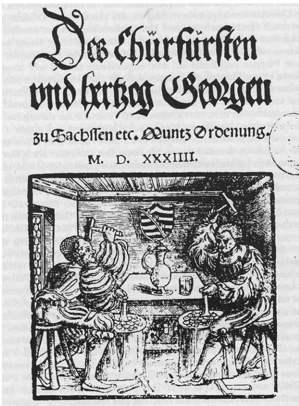
Bild 6: Münzprägung auf dem Titelblatt der sächs. kurfürstl. Münzordnung von 1534.

der Arbeit, die ganz ohne Münzstempel arbeiten und deren Tätigkeit eher wie Erzausschlagen als Münzprägen anmutet.