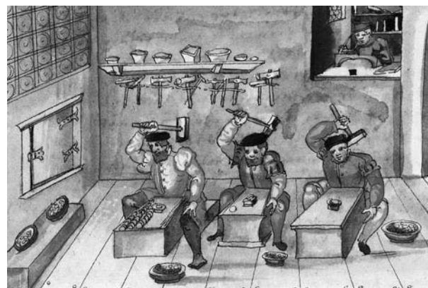
Bild 7: Münzschläger aus dem Schwazer Bergbuch 1556 („Von dem hoch- und weltberühmten Bergwerk am Falkenstein zu Schwaz in der fürstlichen Grafschaft Tyrol und anderen dazugehörigen Bergwerken“).