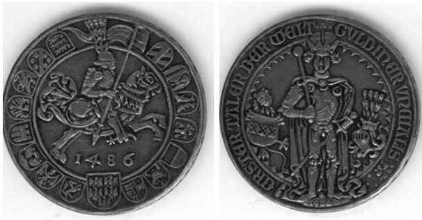
Bild 1: Guldiner von 1486 – der erste Taler. Nachprägung von 1986. Umschrift geändert in: „ERSTER TALER DER WELT / GULDINER UNCIALIS“, Rand nicht gehämmert, mit Randschrift vertieft: „BRIXLEGGGER AUSBEUTE: A 900“.