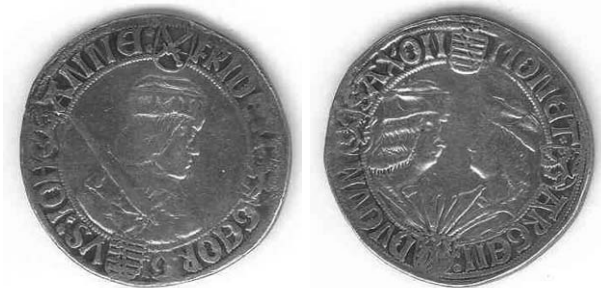
Bild 3: Guldengroschen von St. Joachimsthal aus dem Jahre 1525. Galvano, entspricht dem Original, gehämmertes Rand mit Randpunze „MB“.

guldens prägte. Die ersten sächsischen Großsilbermünzen sind mit hoher Wahrscheinlichkeit von Mai bis September des Jahres 1500 in Annaberg geschlagen worden (W. Haupt 1974, S. 97) und wurden Guldengroschen oder silberne Gulden (Bild 2) genannt. Sie trugen auf der einen Seite das Brustbild des Kurfürsten Friedrich III. und auf der anderen Seite die gegenübergestellten Brustbilder der Herzöge Albrecht und Johann mit Klappmützen. Das Feingewicht des