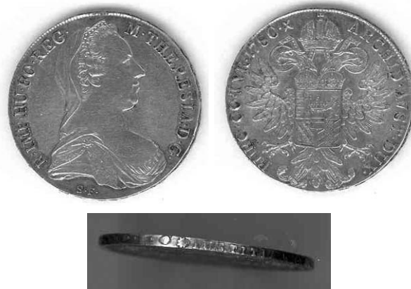
Bild 8: Maria-Theresien-Taler von 1780 mit erhabener Randinschrift: „IUSTITIA ET CLEMENTIA“ (Gerechtigkeit und Gnade).