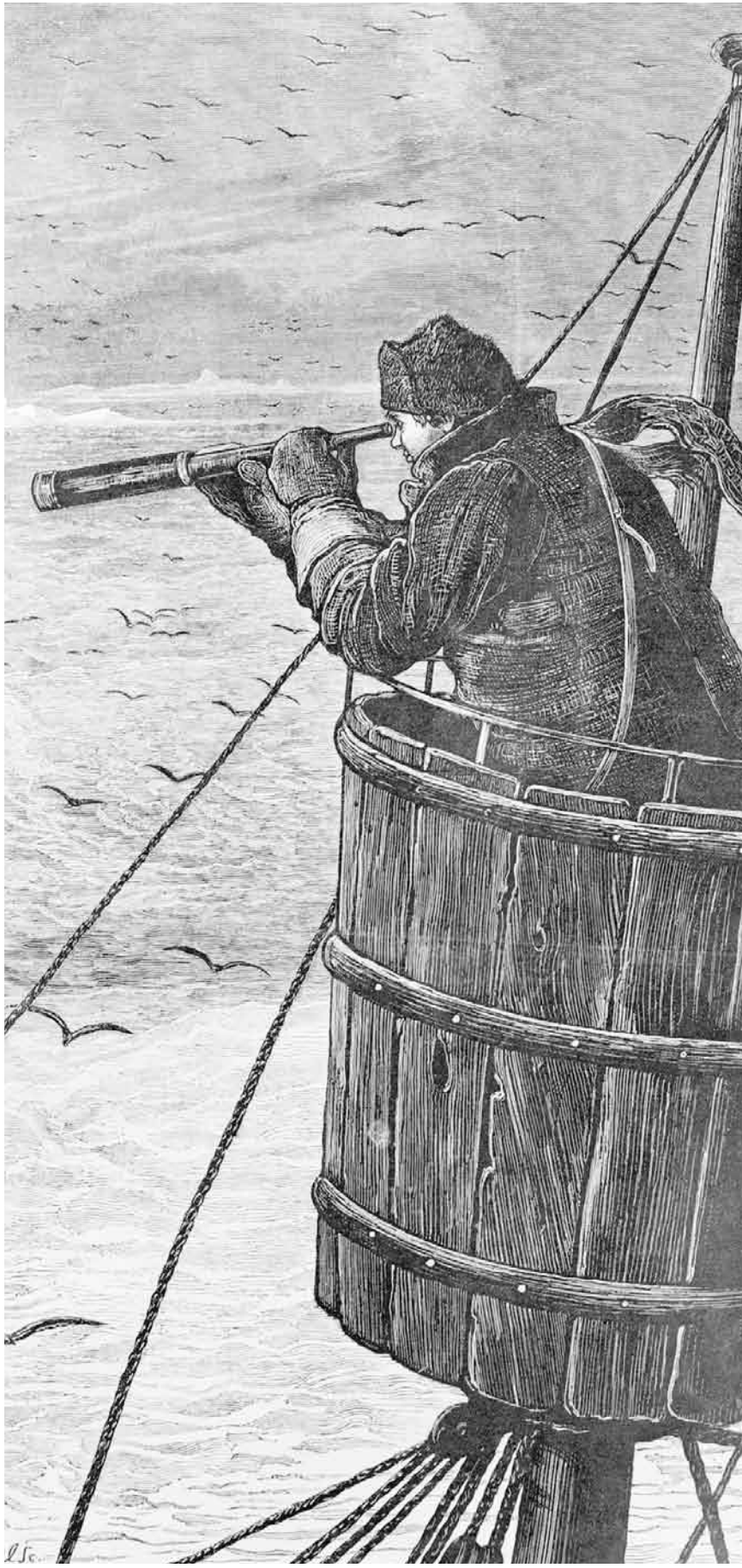
Точка зрения определяется бочкой сидения

Весь мировой опыт, когда оказывают лишние мощности, заключается в том, что государство их консервирует, людей переучивает для новых отраслей, чтобы они не потеряли свои рабочие места. Мы в то время разворачивали новые наукоемкие производства, которые не имели отношения к тому же НПО им. Кирова. Мы развернули тогда