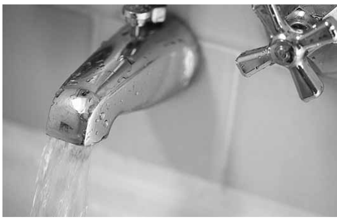
Не забудьте установить счетчик

В Перми прошел межрегиональный форум «Энергосбережение и энергоэффективность»