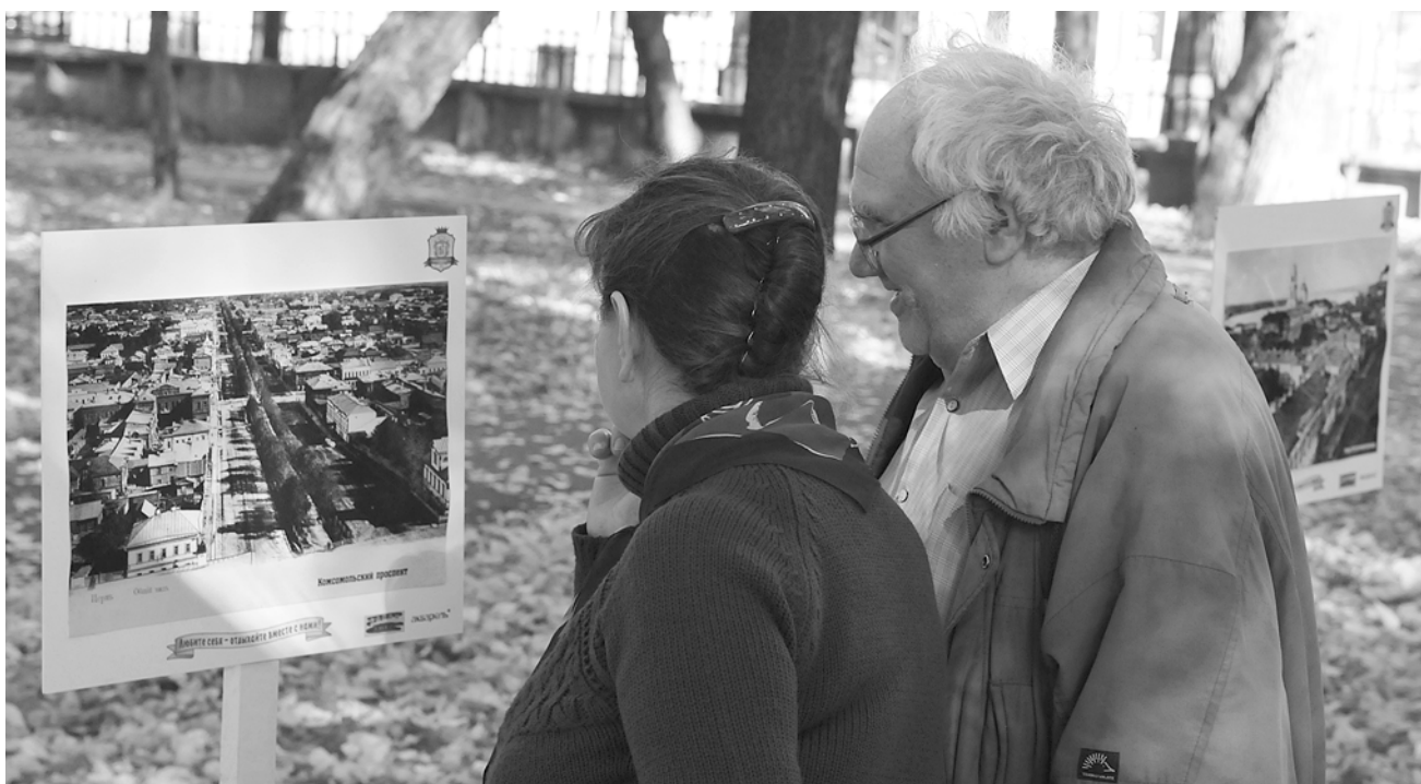
А мне 17 лет...

Кстати, все желающие перьяки могут представить на выставку собственные фотоработы, и, если они окажутся достойного качества, их разместят в экспозиции, продолжая фотолетопись Прикамья, начатую более века назад.