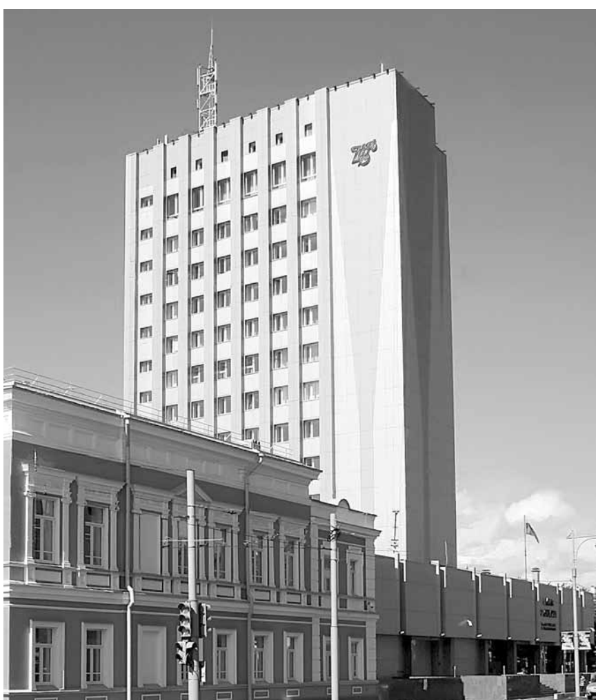
Благодаря усилиям Банка России объемы кредитования в стране восстанавливаются

В этом году на базе Главного управления планируется проведение