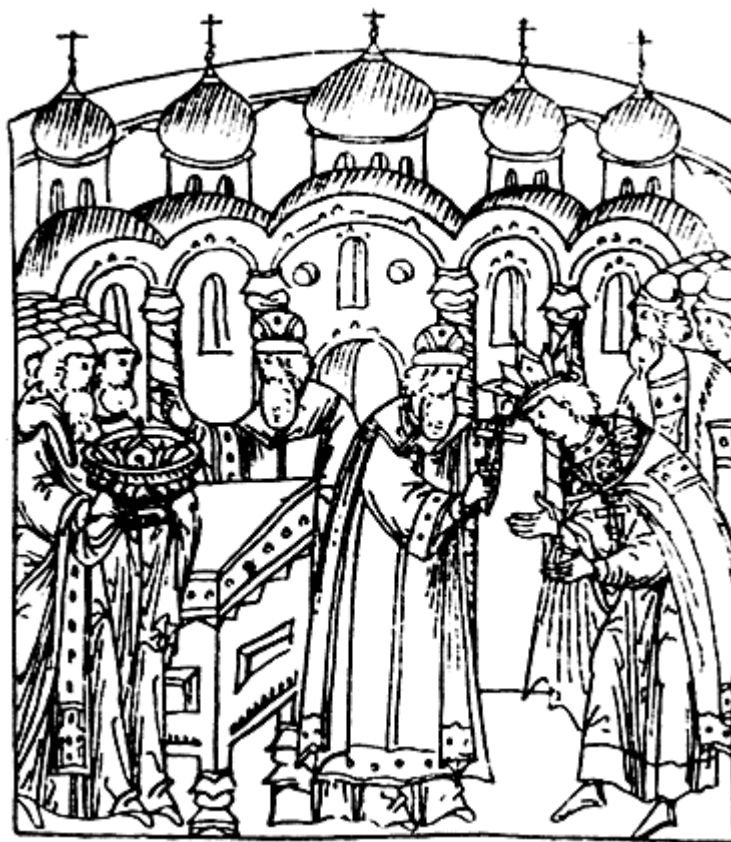
Венчание на царство Ивана IV. Миниатюра из Лицевого свода XVI века.

обращая внимания на просьбы малолетнего государя пощадить того или иного боярина. В этой обстановке насилия выковывался характер государя.