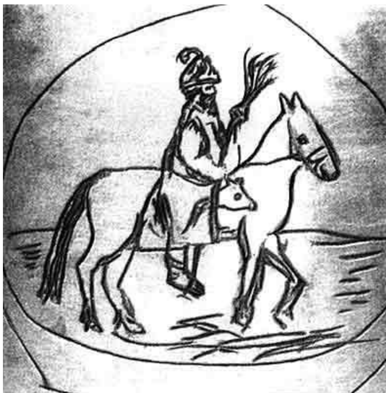
Гравировка по металлу - на поддоне подсвечника XVIII века. Опричник на коне с метлой и песьей головой.

Но опричные пиры были далеки от идеального монашеского аскетизма (впрочем, не так уж часто посещавшего и настоящие монастыри). Описавшие опричный “монастырь” служившие в опричнине ливонские дворяне Иоганн Таубе и Элерт Крузе сообщают: “...каждому подается еда и питье, очень дорогое и состоящее из вина и меда” . Попойки сменялись долгими и изнурительными богослужениями, подчас ночными. Таубе и Крузе рассказывают, что время, которое царь Иван проводил за церковной службой, вовсе не было потрачено даром: “Все, что ему приходило в голову, одного убить, другого сжечь, приказывает он в церкви” .