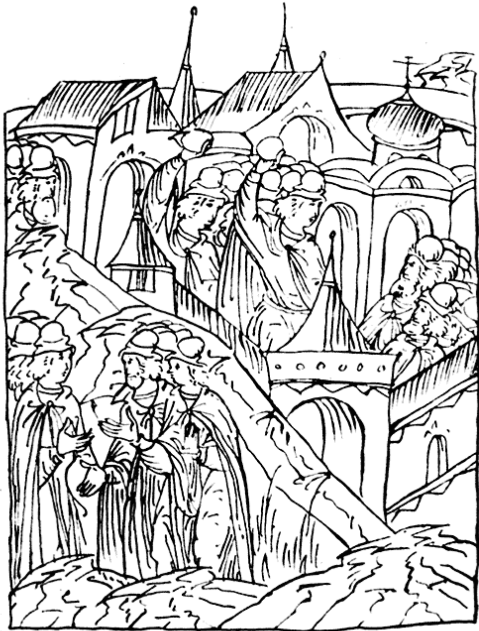
Московское восстание 1547 года. Убийство Ю. Глинского. Миниатюра из Лицевого свода XVI века.

Московское восстание лета 1547 года было не единственным народным движением той поры. Помимо уже упоминавшихся волнений пищальников и псковичей известно восстание в Опочке против сборщика податей. На его подавление пришлось отправить двухтысячную рать. Непокойно было и в Новгороде.