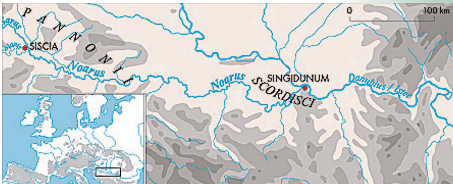
Slika 1: Reka Noar pri Strabonu – drugo ime za Savo ali njen spodnji tok (po Šašel Kos, cit. v op. 8)

ra pri vasi Krka pri Ivančni Gorici, obe reki se izlivata v Savo, Ljubljanica pri Zalogu, Krka pri Brežicah. 6