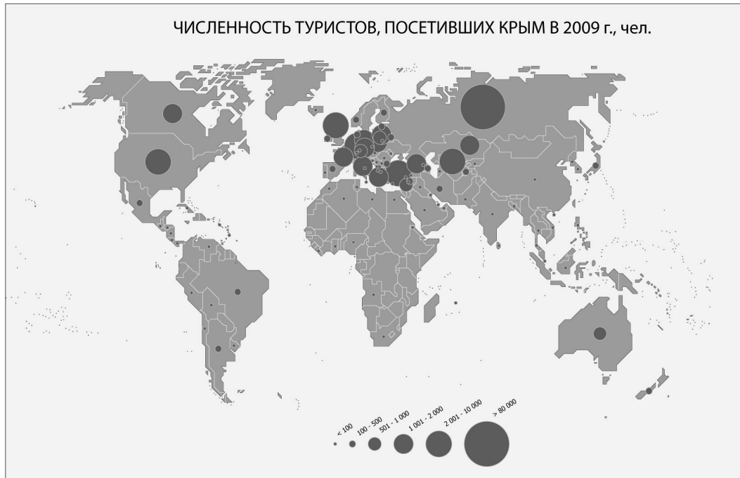
Рис. 2. Численность туристов, посетивших Крым в 2009 г., чел.