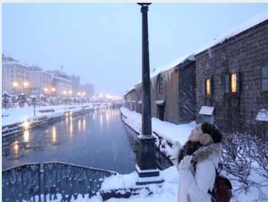
WSS 10269 莊杏兒 (PSD I) 日本之旅