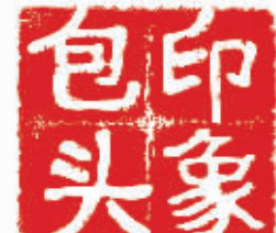
包头日报社 包头市档案局 合办

一号高炉出铁剪彩的消息。1961年9月,时任教育部副部长叶圣陶、老舍等文化名人来包访问,阎充英作为随行记者作了及时报道。他回忆,当时,正值我国经济生活遭遇严重困难的时候,《包头日报》由于纸张供应紧张,由对开4版压缩为2版,但是,在那个激情燃烧的年代,一张小小的党报却成为一面鼓舞人心的旗帜,点亮了人们贫乏的精神生活。