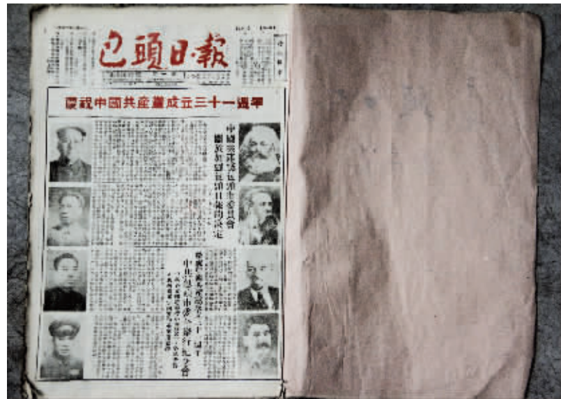
图为1952年7月1日《包头日报》第一号