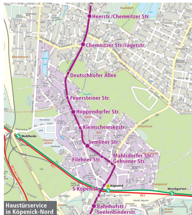
Haustürservice in Köpenick-Nord

Zwischen den Haltestellen Alt-Kaulsdorf/Chemnitz Str. und Chemnitz Str./Jägerstr. können Sie vom Kleinbus im markierten Gebiet bis zur Haustür gebracht werden. Das Gebiet wird begrenzt durch die Straßenzüge Alt-Biesdorf und Alt-Kaulsdorf im Norden, durch die Ortsteilgrenze zu Mahlsdorf im Osten, durch das Waldstück Dammeide, die Falkstätter Str., Straße 19, Straße An der Wuhle und Zimmermannstr. im Süden sowie durch die Wuhle im Westen.