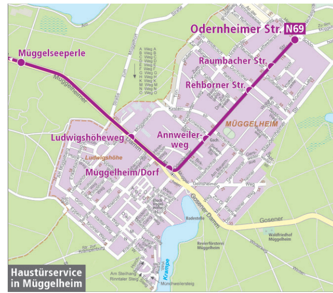
Haustürservice in Müggelheim

Zwischen den Haltestellen S Köpenick und Chemnitz Str./Jägerstr. können Sie vom Kleinbus im markierten Gebiet bis zur Haustür gebracht werden. Das Gebiet wird begrenzt durch die S-Bahn im Süden, durch die Köpenicker Str. im Westen, durch die Zimmermannstr., Straße An der Wuhle, Straße 19, Falkstätter Str. sowie durch das Waldstück Mittelheide im Osten.