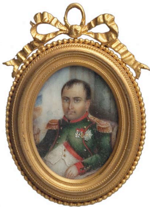
Nº Inventario: 4523. Descoñecido Napoleón Bonaparte. Francia Acuarela sobre marfil. 3 x 2.5 cm Museo municipal de Vigo “Quiñones de León”

(Para ampliar ver Material didáctico 3: A época napoleónica)