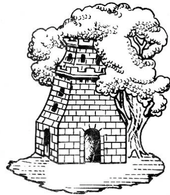
ESCUDO DE VIGO COMO CIDADE

A exemplar acción da vila foi recoñecida como era de xustiza. Con data 1 de marzo de 1810, o Consello de Rexencia de España e Indias, establecido en Cádiz, concede á ata entón vila de Vigo “o privilexio e título de Cidade Fiel, Leal e Valorosa, en atención aos sinalados servizos, heroica lealdade e esforzado denodo manifestado polos seus veciños na defensa da xusta causa da independencia nacional, relevándoa do pago de todo xénero de servizos por esta graza”.