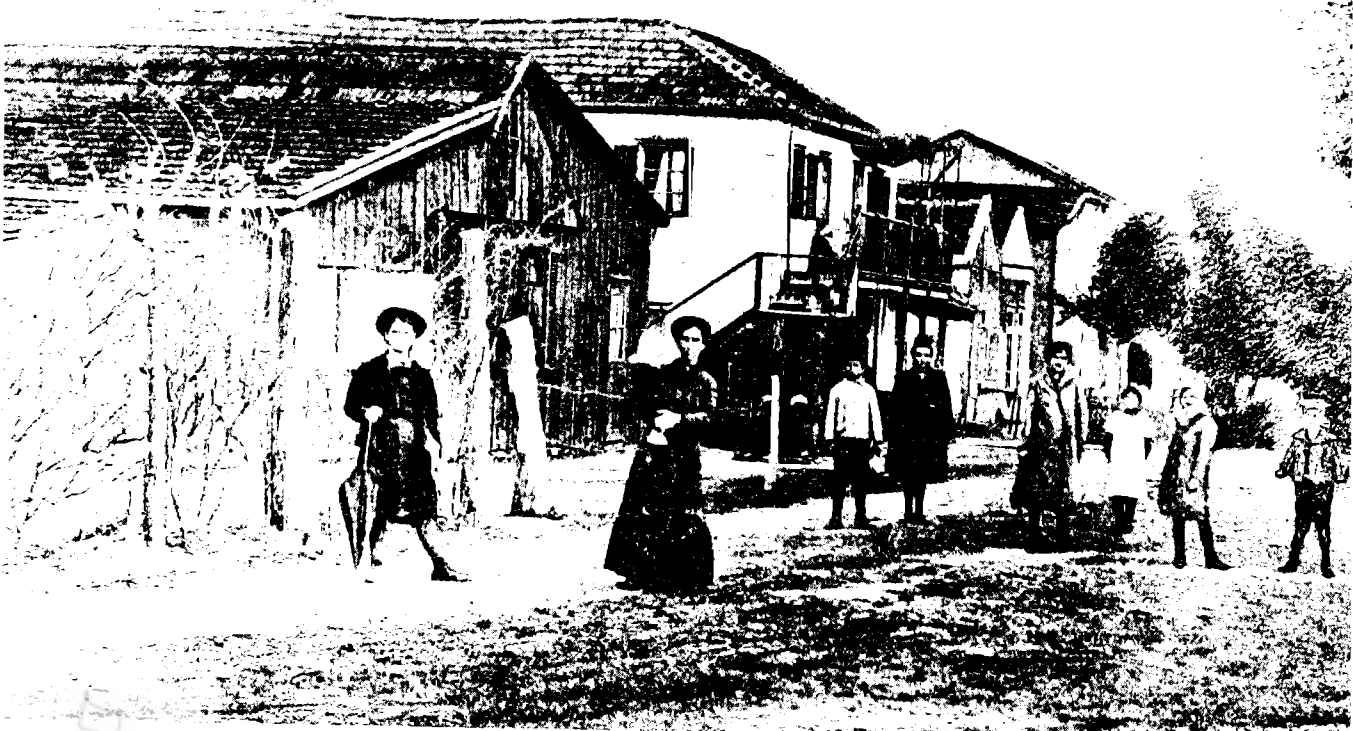
רחוב יהושע שטמפר (בית הספרים הלאומי והאוניברסיטאי)

במונח 'לעבדה ולשמרה' 73 נראה כי השינויים שחלו בשימוש בביטוי זה מאז דרשוהו ראשוני החסידים והפרושים ועד למחצית השנייה של המאה הי"ט, משמעותיים למדי לגבי ההתפתחויות שחלו ביישוב הישן בתקופה זו.