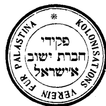
חתום חברת ישוב ארץ-ישראל

ארץ-ישראל בצורת דמי 'החלוקה' ותמצא אימות לחוסר ההתלהבות שבה התקבל הרעיון בקרבם. הדבר עוד הגביר את ההתקפות נגד 'היישוב הישן', עד להאשמתו בנרפות ועצלות. 45 כאן המקום להזכיר כי גם בקרב חוגים רחבים בחברה היהודית בחוץ-לארץ היו מתנגדים לרעיון, אך היושבים בארץ-ישראל ראו אולי את הדברים מקרוב בצורה מפוכחת יותר, בהתאם לתנאים ששררו בארץ. לא תמיד ראו בעבודת האדמה אידיאל שיש לשאוף אליו, ואם בפרנסה מדובר אפשר אולי לנסות גם דרכים אחרות (בתחום הבנייה, המסחר והתעשייה). נקודה נוספת שיש להאיר כאן, היא העובדה שחלק גדול מנימוקי המסתייגים מן הרעיון ומן הביצוע אינם באים ישירות מדבריהם. אין הם מרכיבים להעלות על הכתב את נימוקי ההתנגדות. 46 עלינו ללמוד על כך מדבריהם על מחייבי הרעיון בשעה שהם דוחים את טענות המסתייגים. ניתן להסביר שתיקה יחסית זו על רקע אי-הנעימות והחשש לצאת נגד רעיון אשר נשא בחובו אידיאה של הבראת החברה היהודית ותיקונה. ומכאן גם התופעה שלאחר זמן, בתקופת העלייה הראשונה והשנייה, כאשר רעיון ההתיישבות החקלאית נקלט ובוצע מצניעים ראשי 'היישוב הישן' את תופעת ההתנגדות שהיתה קיימת בחברתם. נבדוק להלן את נימוקי המסתייגים כפי שהדבר עולה מכתבי התקופה.