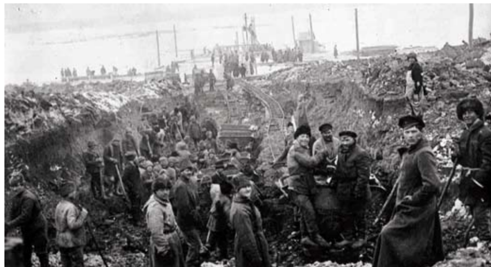
КАШИРСКАЯ ГРЭС СТРОИЛАСЬ В ГОДЫ ГРАЖДАНСКОЙ ВОЙНЫ

С вводом третьего энергоблока установленная мощность Каширской ГРЭС увеличилась до 1910 МВт, что превышает первоначальную в 159 раз. Это огромное достижение, ставшее результатом не только умелого руководства, но и профессионализма рядовых работников ГРЭС: машинистов и слесарей, инженеров и сварщиков, обходчиков и лаборантов – всех тех, для кого энергетика – дело жизни, а электростанция – родной дом.