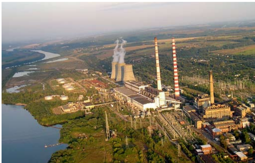
КАШИРСКАЯ ГРЭС С ВЫСОТЫ ПТИЧЬЕГО ПОЛЕТА

Каширская ГРЭС мощностью 12 МВт стала второй по мощности электростанцией в