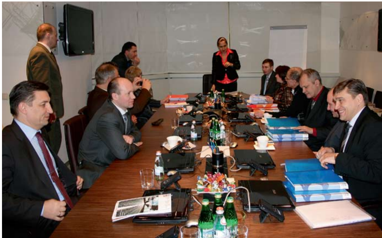
ПРЕДСТАВИТЕЛИ ТРУДОВЫХ КОЛЛЕКТИВОВ ФИЛИАЛОВ И СОТРУДНИКИ ИСПОЛНИТЕЛЬНОГО АППАРАТА ПОДПИСЫВАЮТ КОЛЛЕКТИВНЫЕ ДОГОВОРЫ

Традиции развития социального партнерства работников и работодателей в российской электроэнергетике зародились еще в советские времена. Со временем они претерпели изменения, стали адекватными новой исторической эпохе и нашли достойное продолжение в условиях постреформенной энергетики.