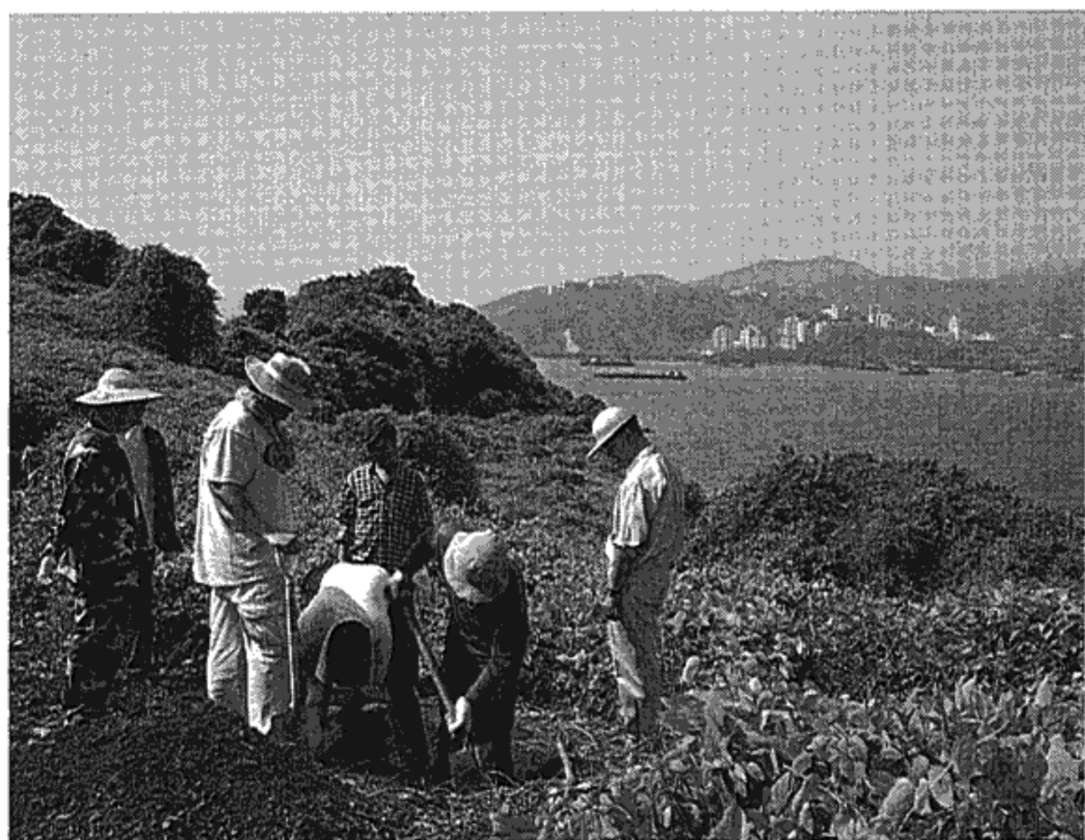
眺望香港中文大學之吐露港6,000年前丫洲遺址

人類樹皮衣石拍幾大的體系。另一方面，在距今三至四千年前，香港及珠三角出現了很多製作環狀飾物的聚落。這些資料在中國玉文化的歷史研究，同樣具有很重要的學術價值。目前我正著手從香港古代玉作坊入手，探索東亞玉器製作工藝的源流。今年我將與俄羅斯考古學者合作，自西伯利亞以至中國東北一帶調查。西伯利亞與香港都發現過相似的史前玉器飾物。地球村的觀念並非為近代專美。為切合今日談話主題之一香港文化的尋根，以下再抽出數項歷年在港澳考古的發現，與諸君共賞析。