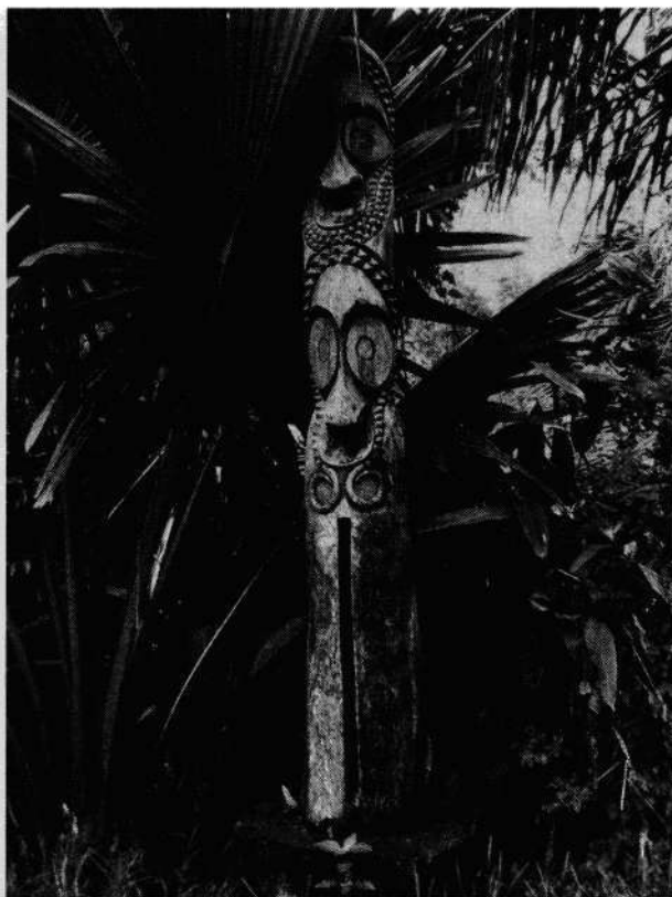
“Атингтинг” – сигнальный барабан с о-ва Амбрим (архипелаг Вануату), подаренный Н. Мишутушкиным Институту этнологии и антропологии РАН. 5 ноября 2009 г. он был торжественно установлен в вестибюле здания Президиума РАН.

шла из печати прекрасно иллюстрированная книга, посвященная этому событию ( Michoutouchkine, Pilioko 2008).