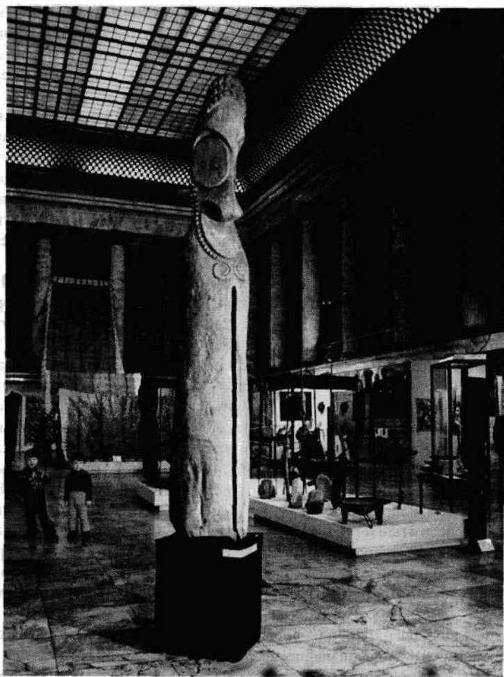
Общий вид выставки "Этнография и искусство Океании" в Мраморном зале Государственного музея народов СССР (ныне – РЭМ). Зима 1980/81 г.