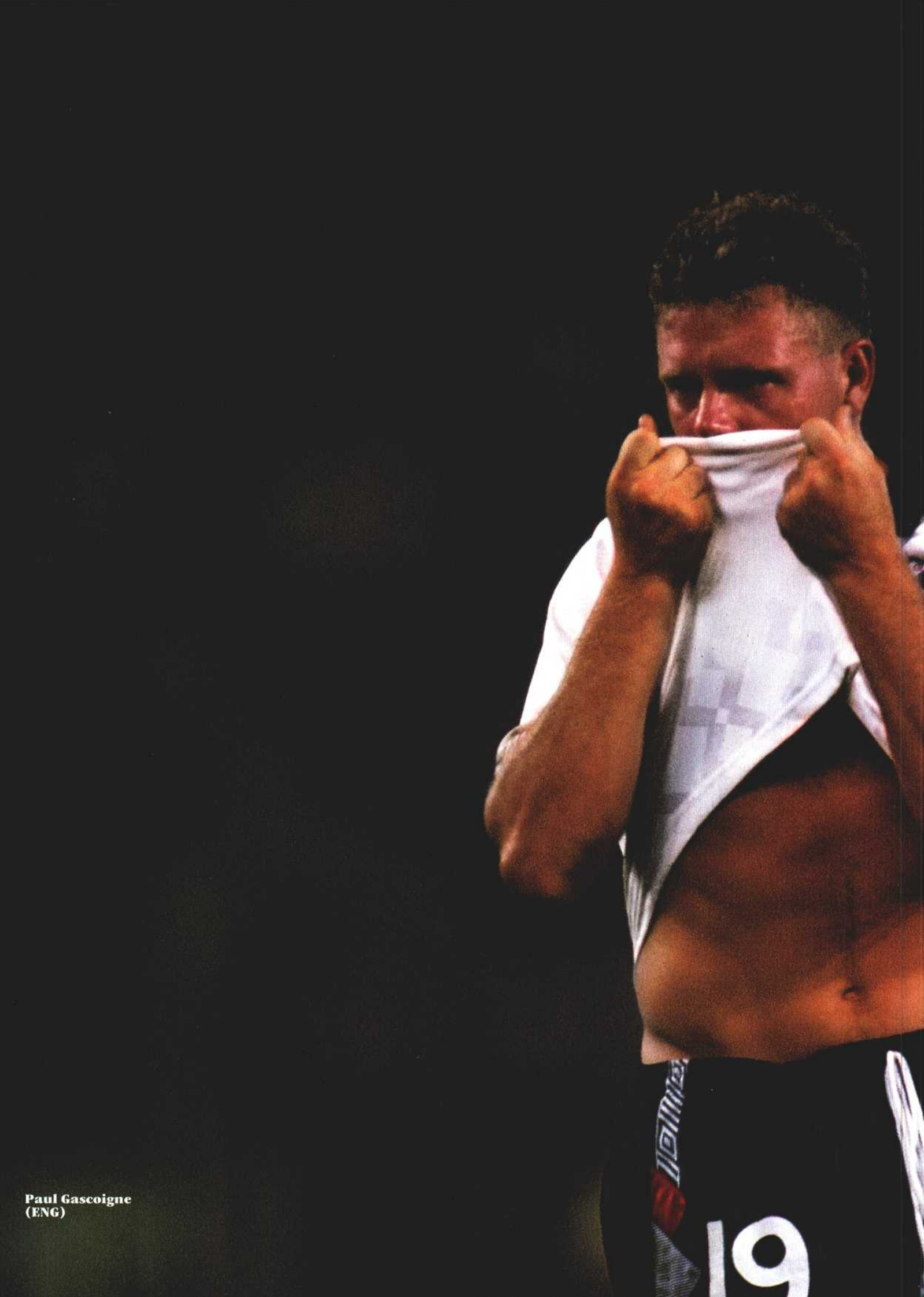
Paul Gascoigne (ENG)