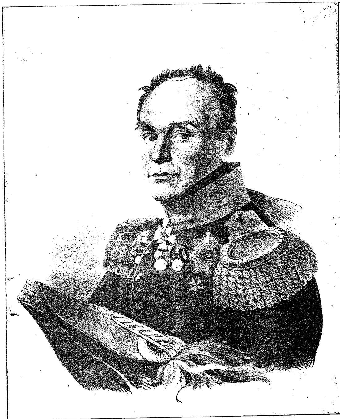
Генераль-лейтенантъ Цвиленевъ Командиръ Новоингерманландскаго пѣхотнаго полка 1806—1810 г.г.