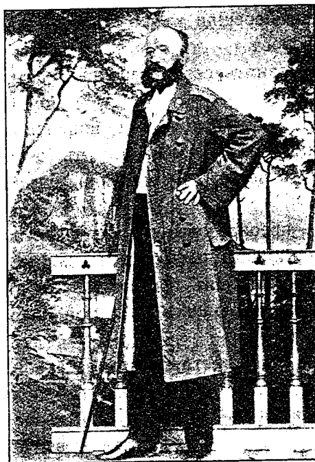
Командиръ пѣхотнаго Новоингерманландскаго полка полковникъ Насакенъ 1854—1863 г.г.

Приближался 1854-й годъ. Россія была наканунѣ войны, начало которой ожидалось съ часу на часъ: 4-го января въ полку было объявлено Высочайшее повелѣніе о прекра-