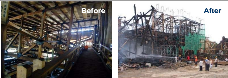
大雪山製材廠火災前後差異

近年來面對國內外接連發生數起重要古蹟及歷史建築遭逢災變，而消失殆盡，令人心痛！我國「文化資產保存法」，雖然對於古蹟文物要求須擬定防災計畫，進行防災管理維護，並頒定「古蹟管理維護辦法」。然從大雪山林場、草山行館等夜間火災事故，凸顯台灣文化古蹟對於防火管理機制之輕忽。另一方面，台灣文化古蹟保存及再利用之防火作為仍停留在依法設置習知的防火區劃與消防設備，不僅破壞古蹟空間意象及原貌，亦可能不符古蹟實際防護需求及目標，例如：突兀的防火區劃及滅火器具，且有著大紅色才是消防設備的代表色之迷思，而需雙人操作的法定消防栓面對夜間無名大火，卻存有苦無人力操作之窘境。本文探討台灣文化古蹟火災防護現況與課題，並提出世界性文化古蹟火災防護的趨勢及思維，供使用者、古蹟管理者及相關單位參考。