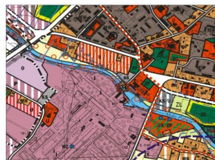
WYRYS ZE STUDIUM UWARUNKOWAŃ I KIERUNKÓW ZAGOSPODAROWANIA PRZESTRZENNEGO GMINY OZIMEK - ZMIANA 2006 r.