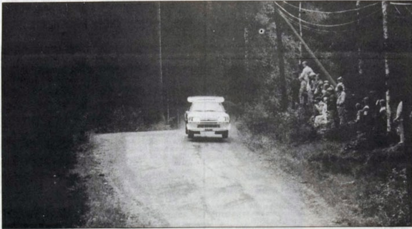
Sieltä Juhat porhalsivat.

–MM-kulta on kauempana kuin uskottekaan. Eroa on vasta 22 pistettä, ja pisteitähän on