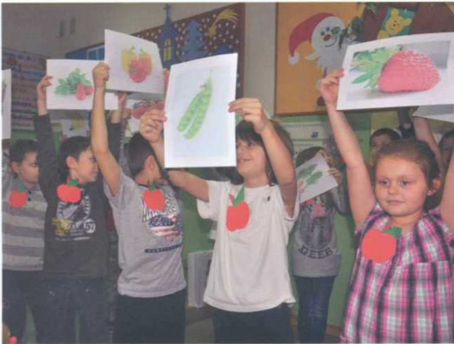
Podsumowanie konkursu. Dzieci ze Szkoły Podstawowej w Moszczenicy, grudzień 2013 r.