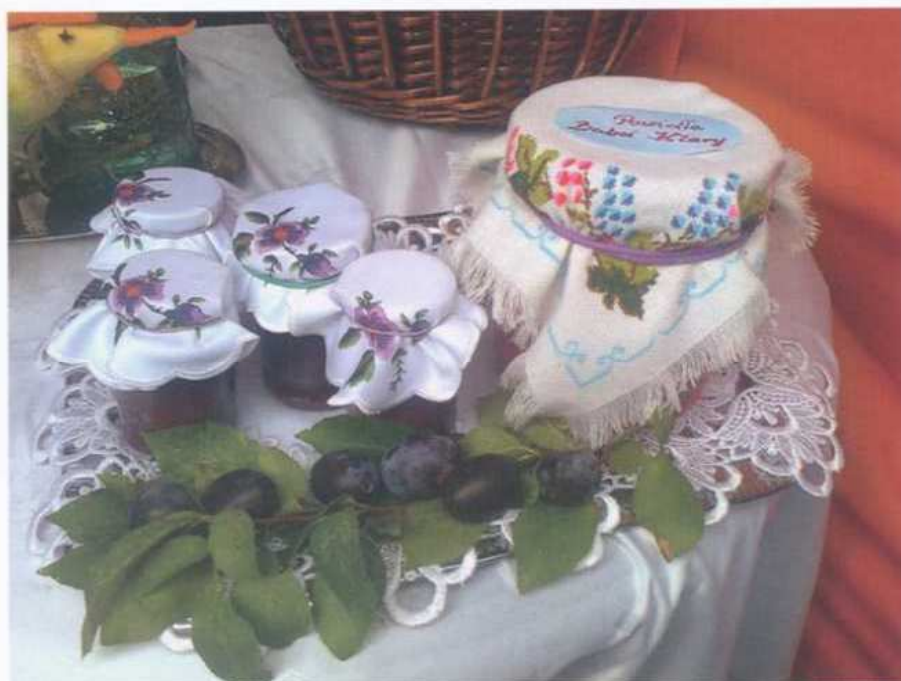
Powidła śliwkowe. Konkurs podczas Dożynek Prezydenckich w Spale, wrzesień 2013 r.

Konkurs zorganizowany we współpracy ze Starostwem Powiatowym w Tomaszowie Mazowieckim dla lokalnych Kół Gospodyń Wiejskich.