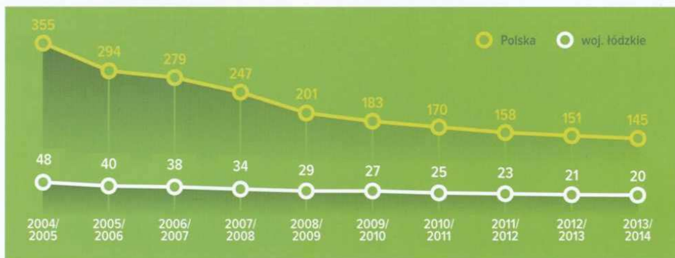
Liczba dostawców hurtowych w latach kwotowych 2004/2005–2013/2014 (w tys.)

W związku z decyzją Parlamentu Europejskiego od 1 kwietnia 2015 r. nastąpi zniesienie systemu kwotowania produkcji mleka. Reguły, jakie mają obowiązywać na rynku mleka, Rada UE zawarła w rozporządzeniu zwanym „pakietem mlecznym” i zobowiązała państwa członkowskie do uwzględnienia ich w prawodawstwie poszczególnych krajów.