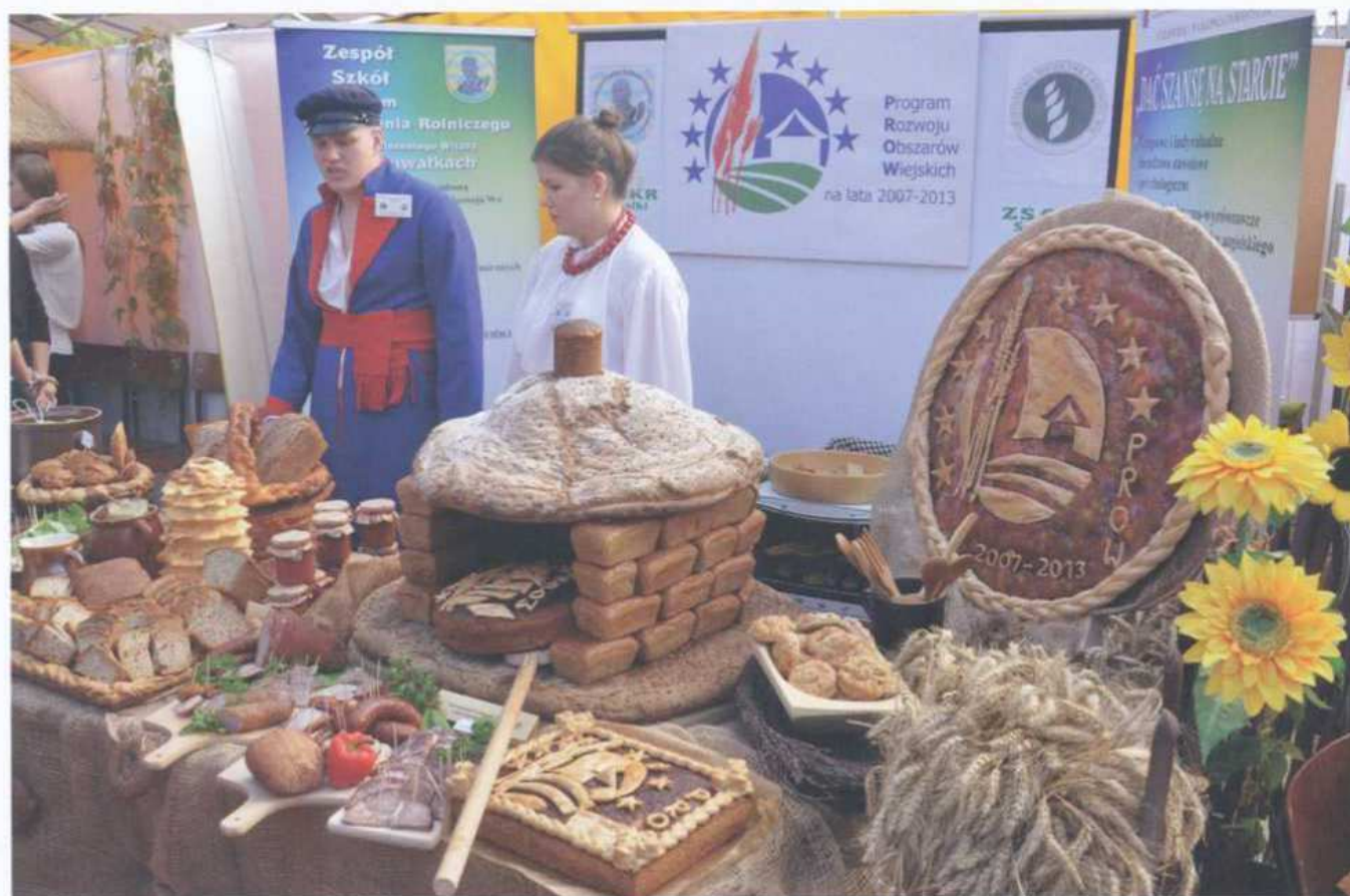
Ogólnopolski „Tydzień Chleba” w Zduńskiej Dąbrowie, październik 2013 r.

Pracownicy Sekcji Informacji i Promocji upowszechniają informacje na temat mechanizmów WPR administrowanych przez ARR oraz warunków udziału w tych mechanizmach wśród podmiotów uczestniczących w mechanizmach oraz potencjalnych beneficjentów: przedsiębiorców, zrzeszeń, organizacji producenckich działających w branży rolno-spożywczej itp. Działania te mają na celu jak najlepsze przygotowanie beneficjentów do wykorzystania środków unijnych i krajowych.