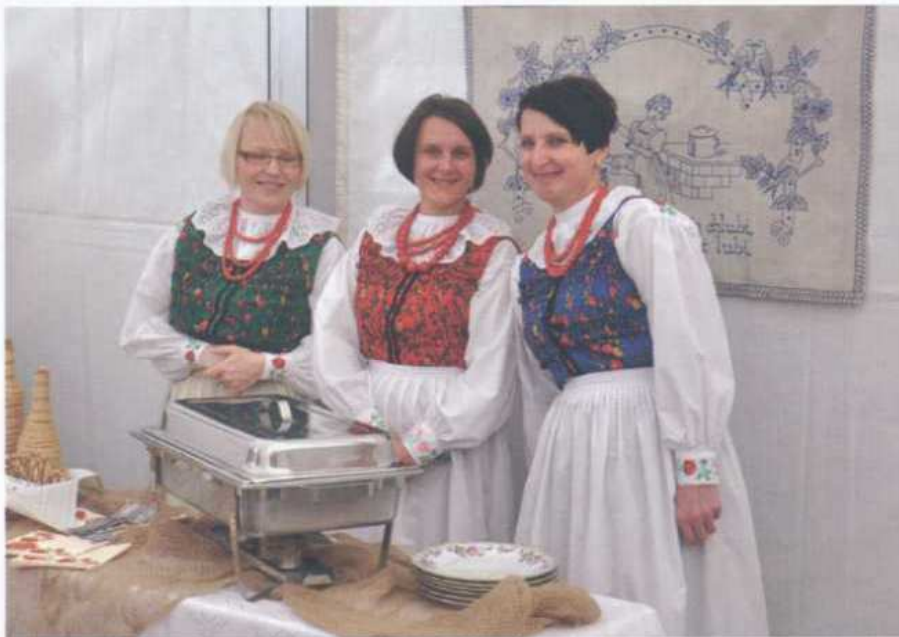
Podsumowanie konkursu w Buczku. Koło Gospodyń Wiejskich w Chojnem, czerwiec 2013 r.