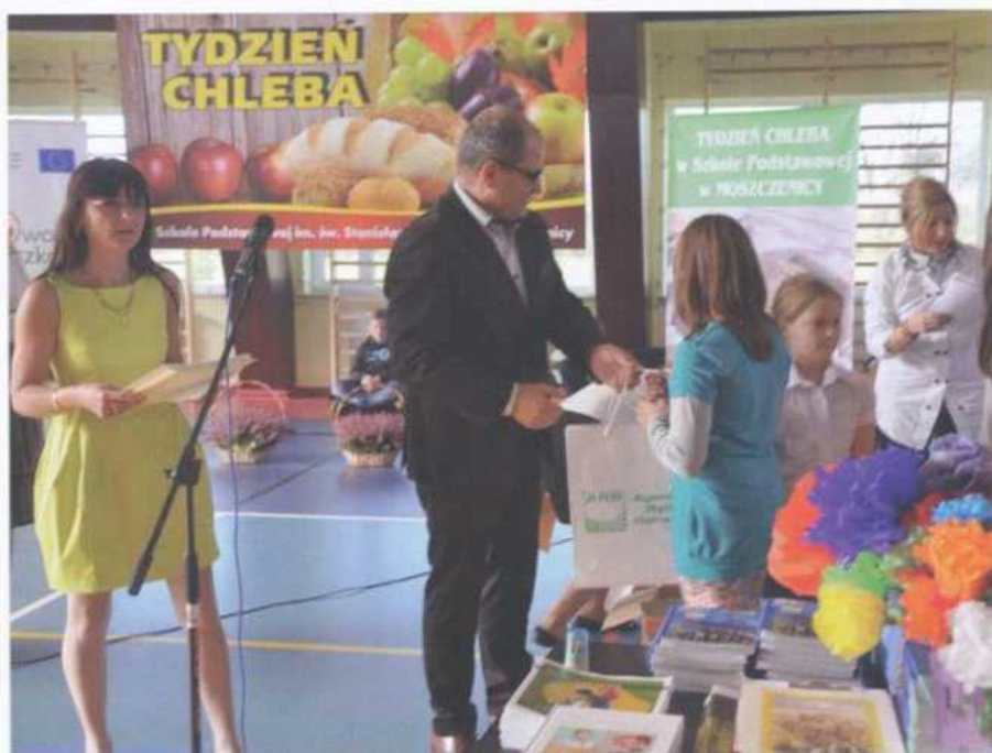
„Tydzień żytniego chleba w szkole”, Szkoła Podstawowa w Moszczenicy, październik 2013 r.

Kampanie przeprowadzone w szkołach zwracały uwagę na wartość zdrowotną chleba jako podstawowego pokarmu, szczególnie wypiekanego zgodnie z tradycją z żytniej mąki, na zakwasie. Obchody „Tygodnia” były okazją do spotkania się całej społeczności szkolnej, a niekiedy również lokalnej – dzięki czemu idea programu wykraczała poza progi szkolne.