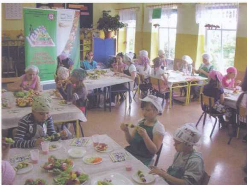
„Lekcja zdrowia” w Szkole Podstawowej w Zelowie, maj 2013 r.

cyjną formułę. Były prowadzone w formie zabawy i obejmowały część teoretyczną oraz praktyczną, kształtującą umiejętność przygotowywania zdrowych posiłków.