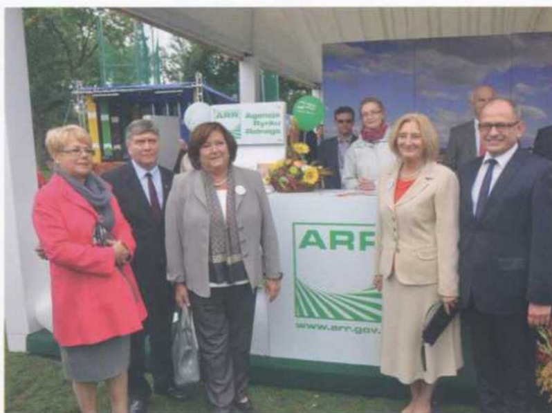
Stoisko podczas Dożynek Prezydenckich w Spale, wrzesień 2013 r.

Program ten cieszył się ogromną popularnością wśród uczniów i nauczycieli szkół podstawowych. Jego celem była szeroko rozumiana promocja postaw prozdrowotnych, zwłaszcza prawidłowego odżywiania, aktywności fizycznej oraz zwrócenie uwagi na niekorzystny wpływ używek na zdrowie uczniów. Zajęcia, w których w sumie uczestniczyło około 400 dzieci, miały bardzo atrak-