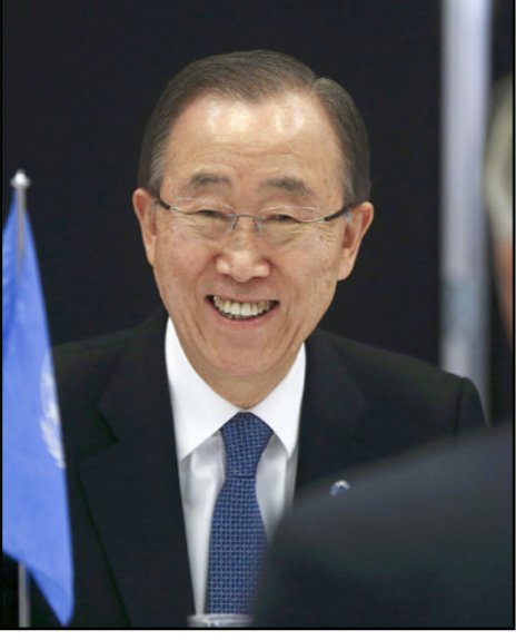
الأمين العام للأمم المتحدة بان كي مون