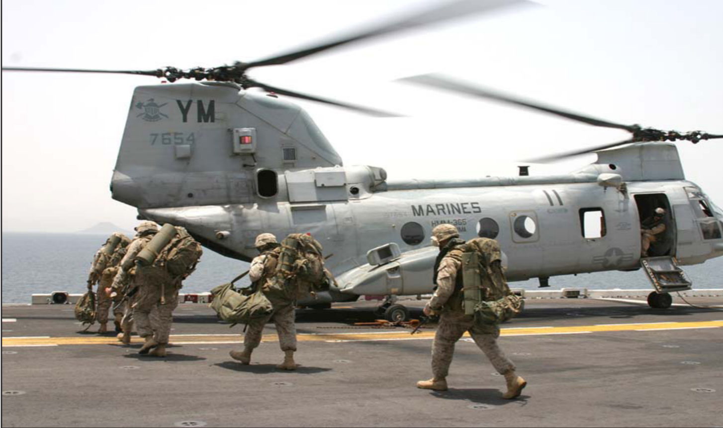
الطائرة المروحية بوينغ المخصصة لعمليات الكماندو والإجلاء

وتعتبر روتا قاعدة عسكرية مشتركة بين إسبانيا