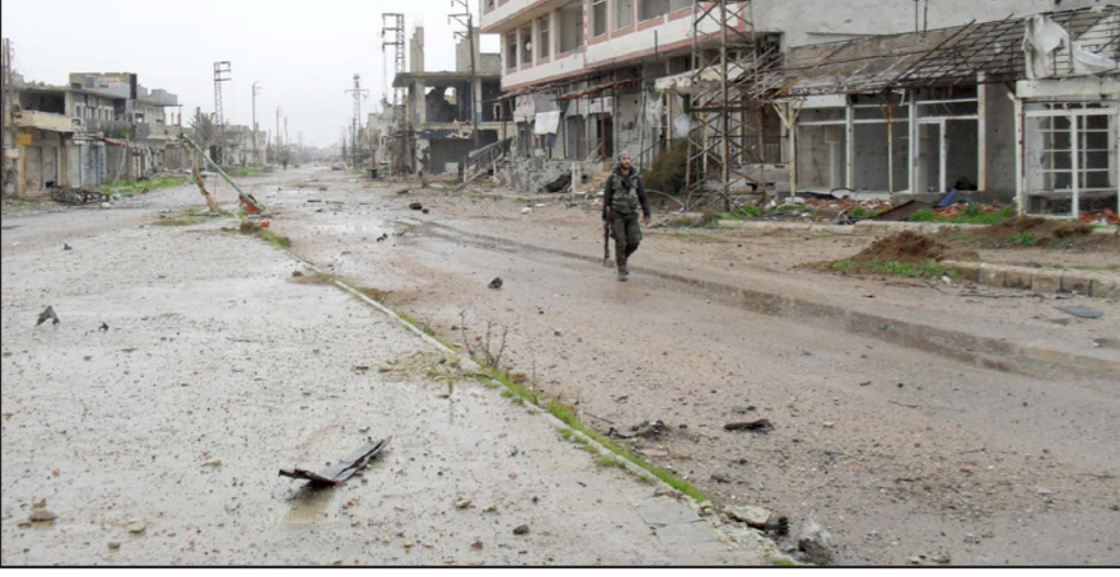
عصر من الفصائل السورية المقاتلة في أحد شوارع درعا وقد خلّى من السكان