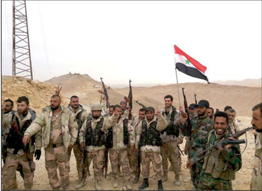
عناصر من الجيش السوري ترفع العلم على مدينة تدمر الأثرية

■ عواصم - وكالات: التحق الجيش السوري بدمر روسي الأحد هزيمة ساحقة بتنظيم «الدولة» الجهادي عبر استعادة السيطرة على مدينة تدمر الأثرية ووعد بطرده من معاقله الرئيسية في سوريا. وهذا الانتصار هو الأكبر للنظام على الجهاديين منذ بدء تدخل روسيا الحليفة الكبيرة للرئيس بشار الأسد في الحرب الدائرة في سوريا في أيلول/سبتمبر 2015. ويعد استعادة المدينة الأثرية التي يعود تاريخها إلى أكثر من ألفي عام، لم يبق أمام الجيش إلا طرد عناصر التنظيم من بلدة العليانية على بعد 60 كلم جنوباً لاستعادة البادية السورية بالكامل والتقدم نحو الحدود العراقية الخاضعة بالجزء الأكبر منها للتنظيم. وأشاد الرئيس بشار الأسد باستعادة السيطرة على المدينة معتبراً ذلك «إنجازاً مهماً». وقال الأسد خلال استقباله وفداً برلمانياً فرنسياً في دمشق إن استعادة تدمر تعد «إنجازاً مهماً وديلاً جديداً على نجاعة الاستراتيجية التي ينتهجها الجيش السوري وحلفاؤه في الحرب على الإرهاب». واعتبر أيضاً أن ذلك يظهر «عدم جدية التحالف الذي تقوده الولايات المتحدة ووضم أكثر من ستين دولة في محاولة الإرهابيين بالنظر إلى ضلالة ما حققه هذا التحالف منذ إنشائه قبل نحو عام