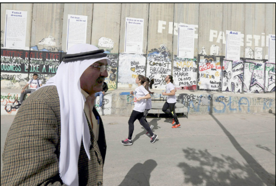
صورة أرشيفية لماراثون العام الفائت

وأكد زيدان أن المجموعات المخصصة للركض تتدرب في مختلف المدن الفلسطينية من بيت لحم ورام الله والقدس وغزة والأراضي الفلسطينية المحتلة في عام 1948. وفي دول عدة في أوروبا وأمريكا قبل موعد الماراثون والبرازة الفلسطينية كهدف أساسي لدعم حريتها خاصة في كل شيء وحرية حركتها من خلال ممارسة الرياضة والركض وهو ما سجل نجاحاً بالغ.