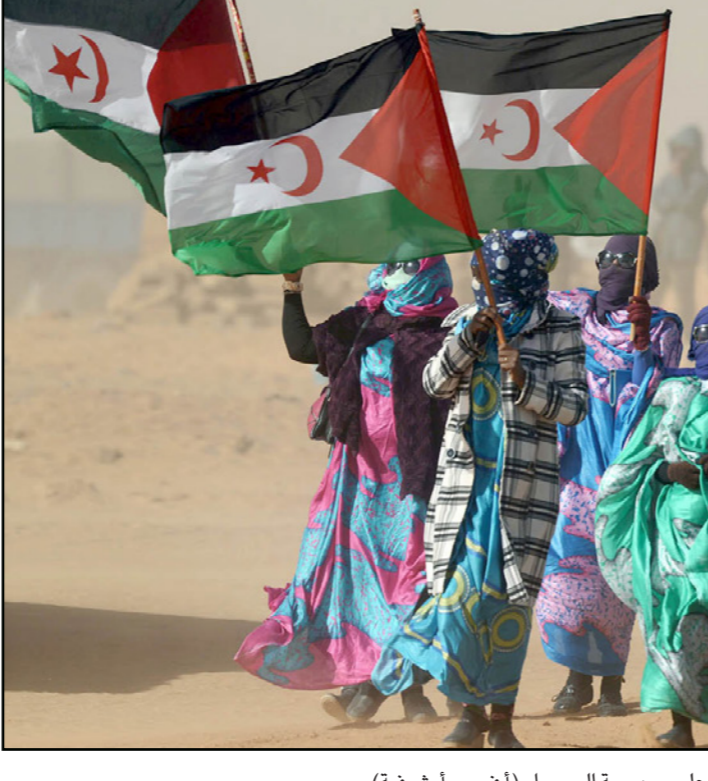
سيدات صحراويات يرفعن علم جمهورية الصحراء (أ ف ب - أرشيفية)

غداً مع أبنائهم الذين يخوضون إضرابا عن الطعام