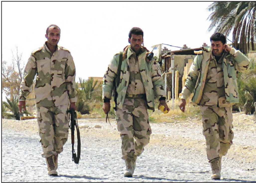
عناصر تابعة للنظام السوري في مدينة تدمر بعد السيطرة عليها أمس