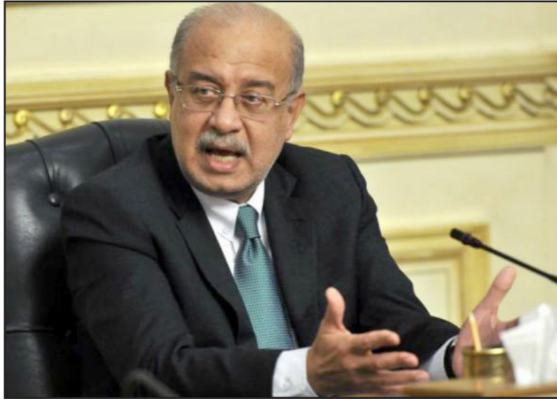
رئيس الوزراء المصري المهندس شريف إسماعيل

وشكلت حكومة إسماعيل في 19 سبتمبر / أيلول الماضي بعد أسبوع من استقالة حكومة إبراهيم محلب، وأجرت إسماعيل تعديلاً وزارياً يوم الأربعاء الماضي شمل عشرة وزراء جدد من بينهم وزراء المالية والاستثمار والسياحة.