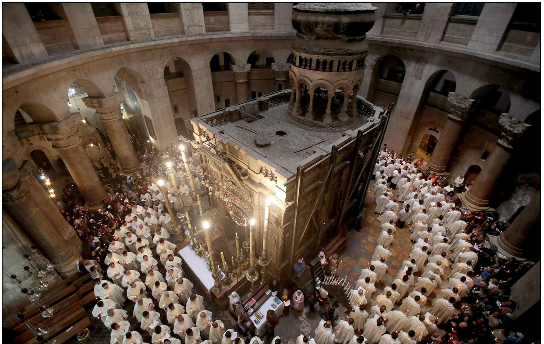
جانب من احتفالات عيد الفصح في مدينة القدس

الشؤون المدنية، تصاريح خاصة لهؤلاء المسيحيين قدرت بنحو 850 تصريحًا، للمشاركة في الأعياد. وذكرت هيئة الشؤون المدنية أنها بذلت خلال الفترة الماضية جهودا كبيرة، أسفرت عن موافقة السلطات الإسرائيلية على إصدار هذا العدد من التصاريح. وتقدم مدينة التصاريح التي أعطيت لهؤلاء المسيحيين شهر ونصف، حيث تستمر حتى