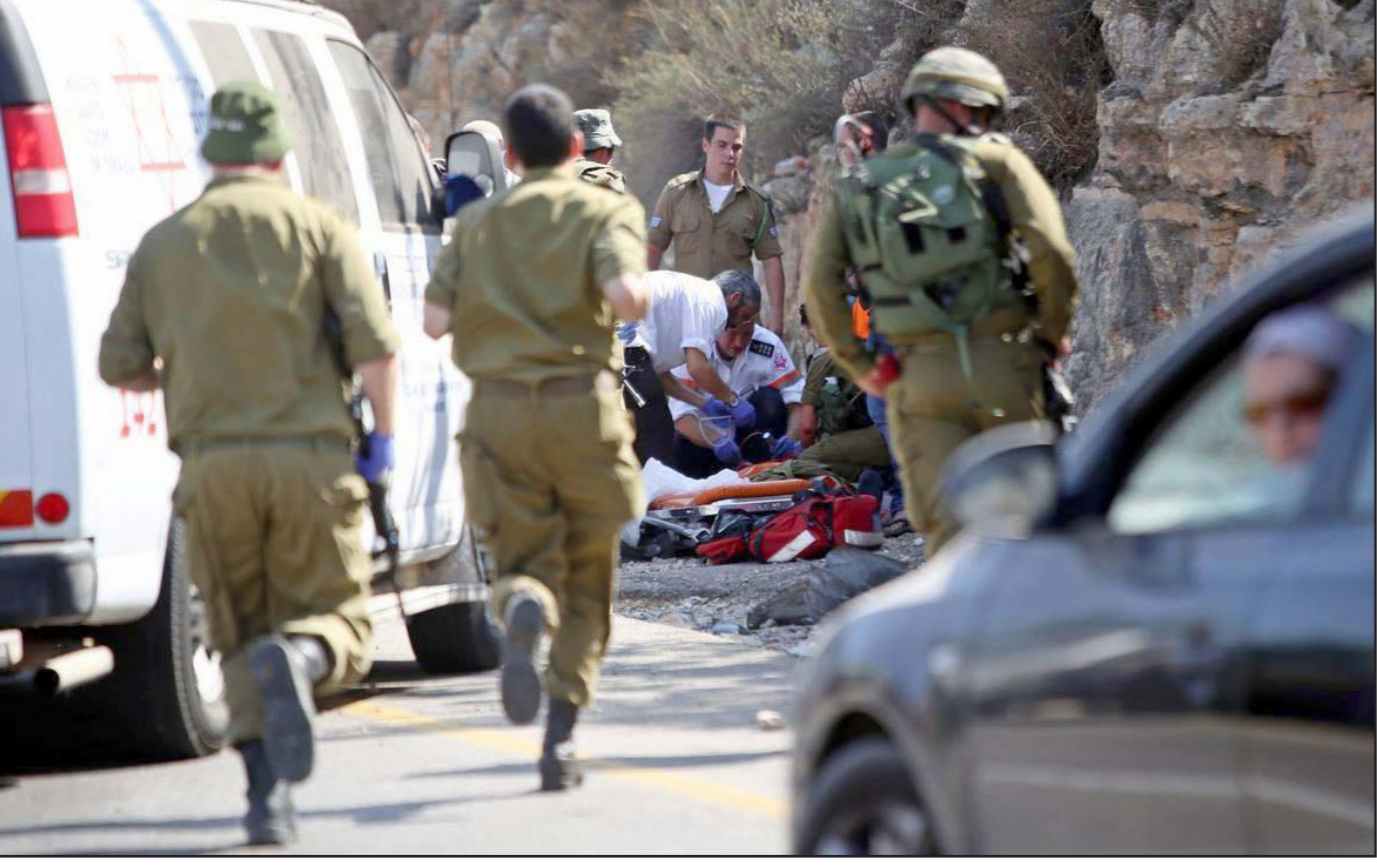
... ويستمر مسلسل قتل الفلسطينيين بدعى محاولات إسرائيليين

اللمية لدى الجنود. حادثة اطلاق النار في الخليل تتحول الآن إلى امر قضائي وامتحان: هل سيسمح الجيش لأحد بتحديد أوامر اطلاق النار، بما في ذلك من يجلسون في الحكومة؟ نظرا لأن الانتفاضة الحالية لا يبدو أنها ستنتهي قريبا، فان تصرف الجهاز الامني سيكون له تاثير على المدى البعيد.