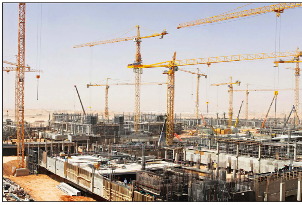
ورشة بناء معطلة تغذيها «سعودي أوجيه» في مركز الملك عبد الله المالي في الرياض

واضاف انه في خلاف ذلك فان «الشركة تواجه الإفلاس». واسبس الشركة نهاية السبعينات من القرن الماضي رئيس الوزراء اللبناني الراحل رفيق الحريري، والد سعد، والذي كان مقربا من العائلة المالكة خصوصا العامل الراحل فهد بن عبد العزيز. وبعد وفاة الحريري في تفجير استهدف موكبه بوسط بيروت في وفي وقت سابق هذا الشهر، افادت صحيفة (عكاظ) السعودية ان وزارة العمل اتخذت اجراءات «لحاسبة» الشركة، من ضمنها تشكيل لجنة للنظر في القضية وقطع خدمات عنها، مشيرة بحسب مصدر في الوزارة، إلى ان الشركة وعدت بدفع كل الرواتب المتأخرة على دفعات. وسأل المصدر المتابع «هل تملك الشركة المصادر لاداءها؟»، ويشير رجل اعمال لبناني في السعودية إلى ان مالية الشركة «كانت تدار بشكل سيء منذ زمن طويل»، معتبرا ان وضعها الراهن يطرح سؤالين «هل تستمر المصارف السعودية في تمويل سعودي أوجيه، وثانيا، هل ستنتج عائلة الحريري في تأمين مستثمر جديد مستعد لضخ الأموال».