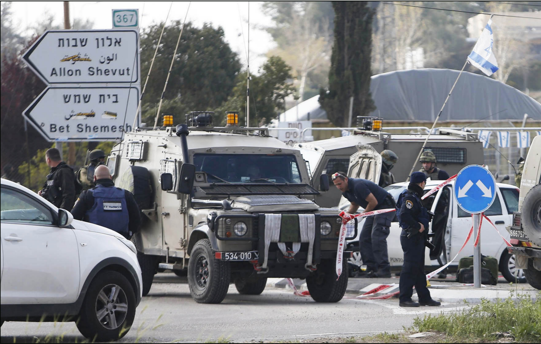
حاجز للجيش الإسرائيلي على مدخل مدينة بيت لحم