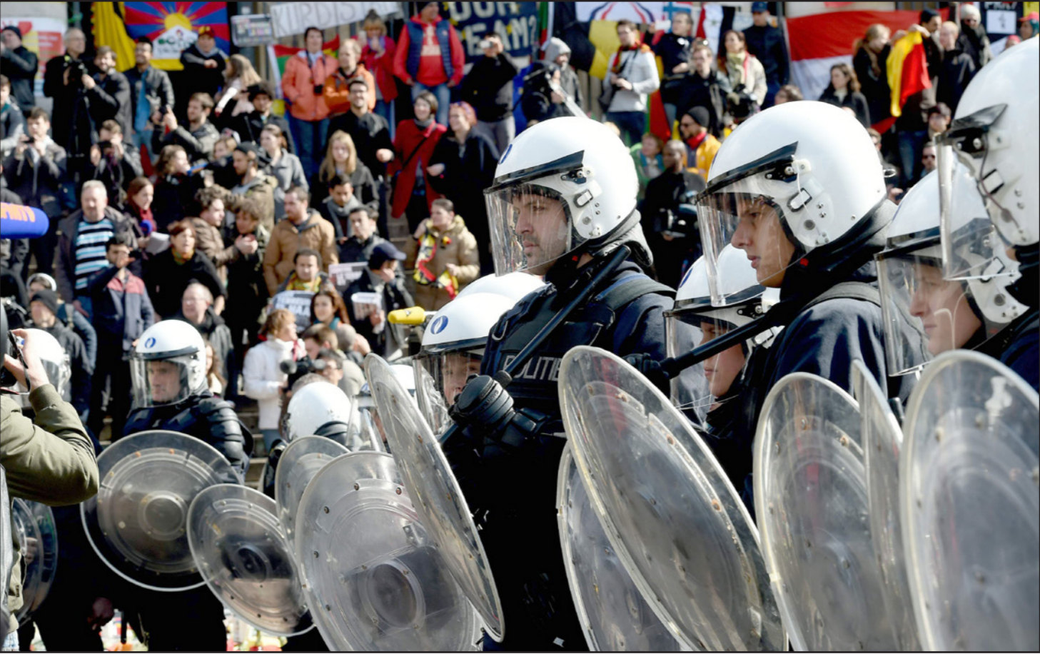
قوات من شرطة الشغب البلجيكية خلال مواجهات مع متطرفين يمينيين وسط بروكسل

ومع ذلك فقد أثارت التحضيرات الطويلة للهجمات وبدون أن تعرف السلطات الأمنية بها وعلاقتها مع هجمات باريس غضب السياسيين والرأي العام والحلفاء في أوروبا وفي الخارج. وسال النائب في البرلمان البلجيكي ماركو فان هيس وزير الداخلية «ماذا كل هذا العجز المستمر». وترى الصحفية أن بلجيكا مثلت مشكلة كبيرة في الكفاح ضد المتشددين. وكان تفكيك شبكية إرهابية في فيرفيه في جنوب البلاد والتي أحبطت عملية كبيرة نصرا للسلطات الأمنية لكنه غطى على المشكلة ولم يحلها وقد انفجرت لاحقا