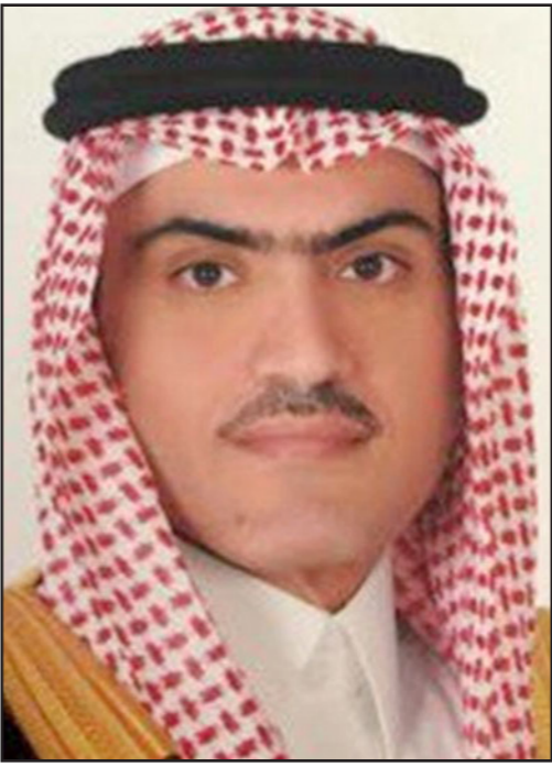
السفير السعودي ثامر السبهان

وقالت في بيانها إن «السبهان تجاوز الخطوط المحرمة هذه