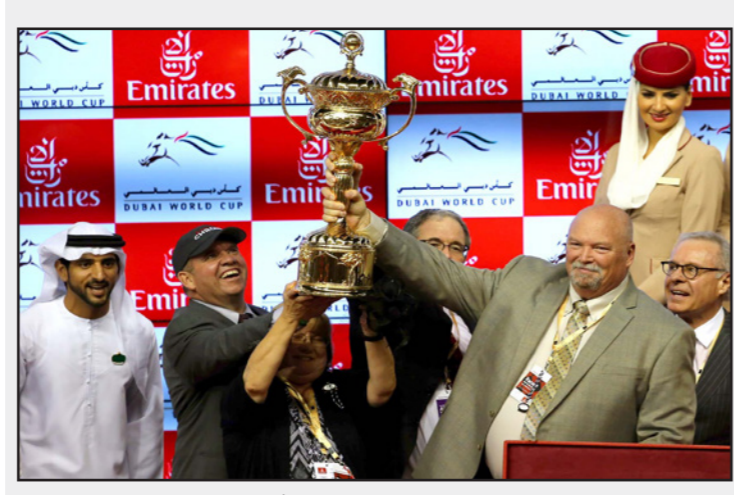
الأمريكي مالك الجواد كالفورنيا كروم يرفع كأس دبي العالمية للخيول