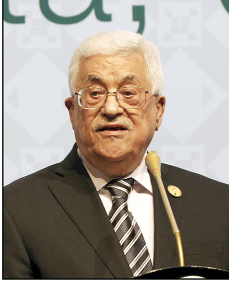
الرئيس الفلسطيني محمود عباس

وقدم مجموعة من الباحثين الذي شاركوا في إعداد هذا التقرير ملخصا اليوم السبت لأهم ما تضمنه خلال ندوة في رام الله نظمها مركز مدار.