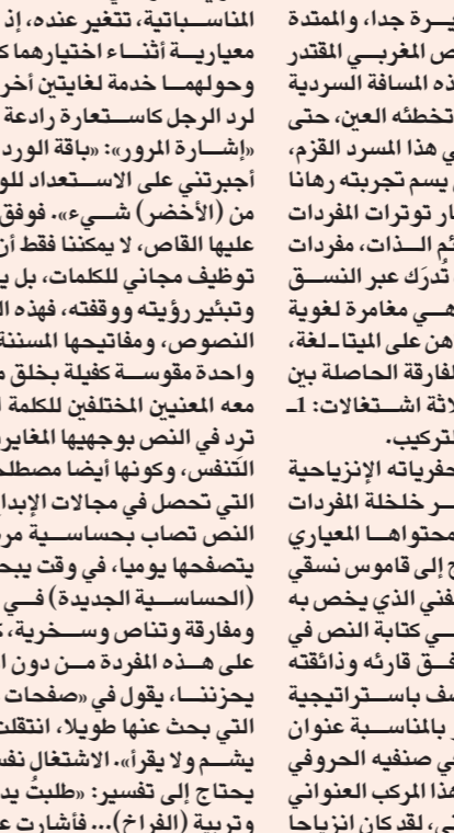
القصيدة قصيرة جدا

تؤدي انزياحات دلالية تحدينا إلى أكثر من مرجع اجتماعي كنهو ثقافي، يسعى القاص إلى أن يدفع بالقارئ إلى تمثل السياق العام الذي يتضح بمواقف وسلوكيات وقيم عوجاء، وفق قالب ساخر، لكنه لا يخلو من وجوب انتقاده ومراجعتة ضمينا، هكذا هو حسن برطال يقدم نفسه دائما فكها سائخرا، يمازج قارنه ويلاطفه حتى يترج به في دائرة متعة القراءة وفائدتها، ومن ثم يقف على حجب الخسارات التي تعتور الواقع بكل تناقضاته وإنسلاخاته؛ في قصته «الزوجة الثانية» تصور التحول الذي طال قدسية عش الزوجية نحو استغلال مادي لا غير، يقول: «عاشرتها طويلا،