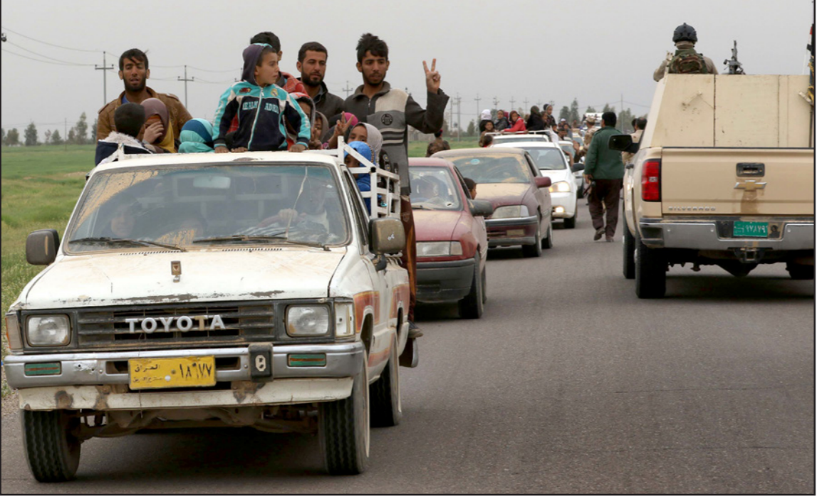
مواطنون يغزون من المعارك الدائرة بين القوات العراقية وتنظيم «الدولة» في الموصل

وأشار الشهود إلى قيام التنظيم في وقت سابق بزج الأراضي بالألغام الأرضية والعبوات الناسفة، وهو ما أعاق تقدم القوات المشتركة. يذكر أن 405 كيلومتراً شمال العاصمة بغداد) في العاشر من حزيران / يونيو 2014 قبل أن يسيطر على مساحات واسعة من العراق.