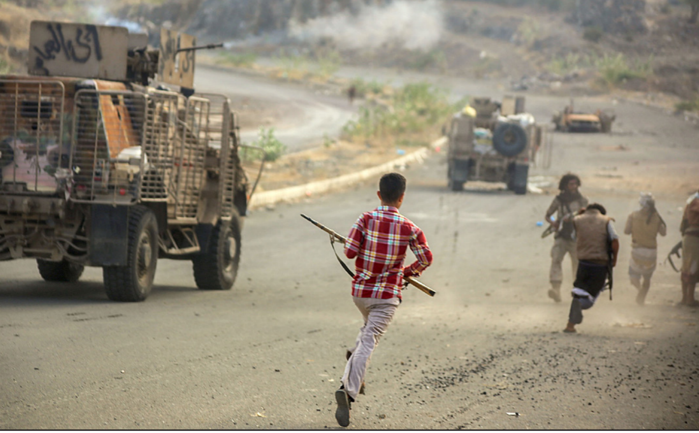
مقاتلون مؤيدون للرئيس اليمني عبدربه منصور هادي في تعز