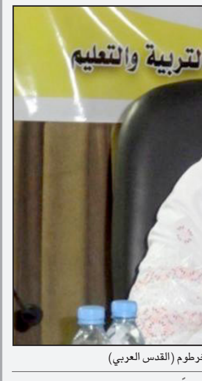
سعاد عبد الرزاق وزيرة التربية والتعليم السودانية في مؤتمرها الصحفي في الخرطوم

القانون الذي يحمي خصوصية الشهادة السودانية. وقالت الوزيرة إن الامتحانات تمت بشكل جيد في جميع مراكز الامتحانات التي تبلغ أكثر من 300 مركز ولم تثبت أي حالة غش على الطلاب السودانيين.