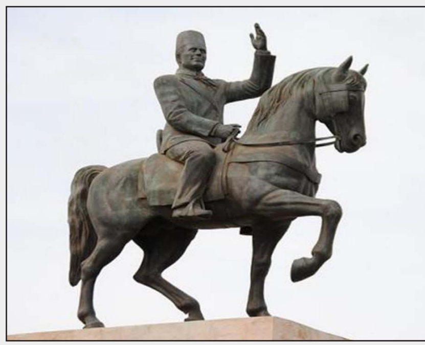
تمثال الحبيب بورقيبة

التوسين، ولم يذكر البيان موعد الانتهاء من اقامة نظام المراقبة الإلكتروني. وأعلن الحبيب الصيد رئيس الحكومة التونسية الجمعة ان بدء العمل بهذا النظام سيطلق في نيسان/ابريل القادم. وقال في مقابلة تلفزيونية «بخصوص (نظام) المراقبة الإلكتروني، هناك دراسات تم إنجازها من الطرف الألماني والولايات المتحدة، وخلال شهر ابريل / نيسان سنطلق في العمل الميداني». يبلغ طول الحدود بين تونس وليبيا نحو 500 كلم، يتم عبرها تهريب الحروقات والسلع وايضا المخدرات والأسلحة. وفي 13 تشرين الثاني/نوفمبر 2015 طالب الطيب البكوش وكان حينها وزيراً للخارجية، نظيره الأمريكي جون كيري بدعم تونس «حتى تكون أقدر على مراقبة حدودها، ونعني دخول الأسلحة والإرهابيين». وفي شباط/فبراير الماضي، أعلنت وزارة الدفاع التونسية الانتهاء من إقامة «مظومة حواجز» تمتد على حوالى نصف الحدود البرية