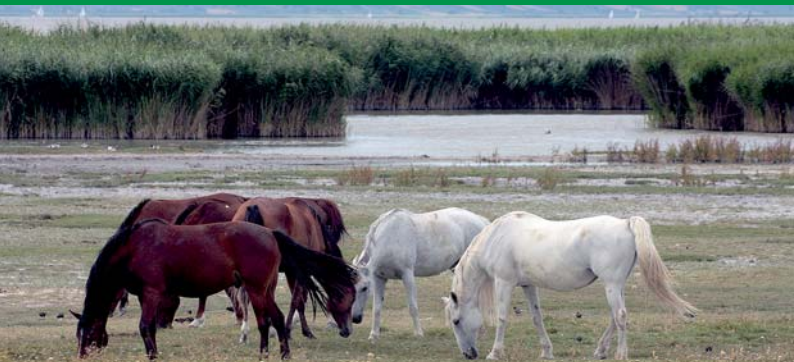
Burgenland: Beweidung mit Pferden am Neusiedler See