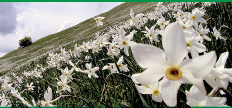
Kärnten: Narzissenwiese in den Karawanken