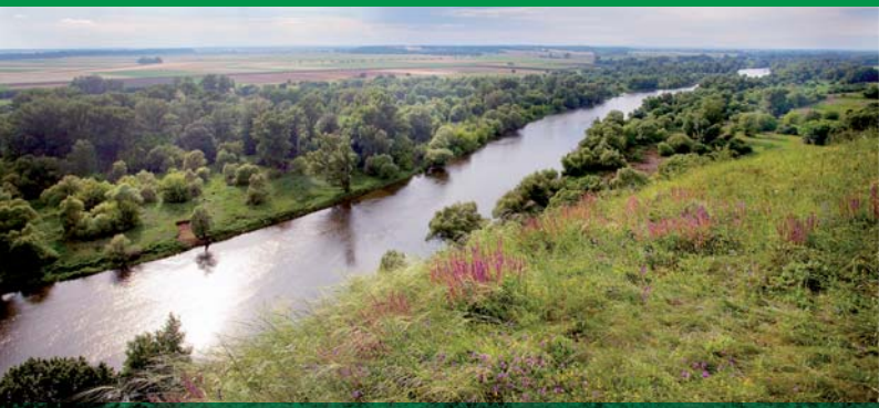
Niederösterreich: Blick auf die March vom Thebener Kogel