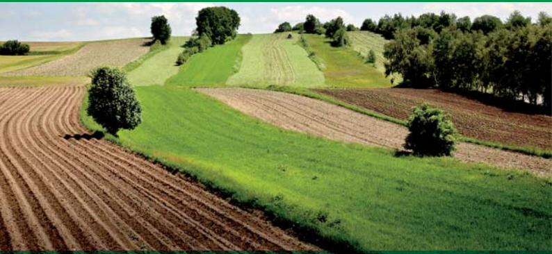
Niederösterreich: Grünstreifenflur in Großschönau