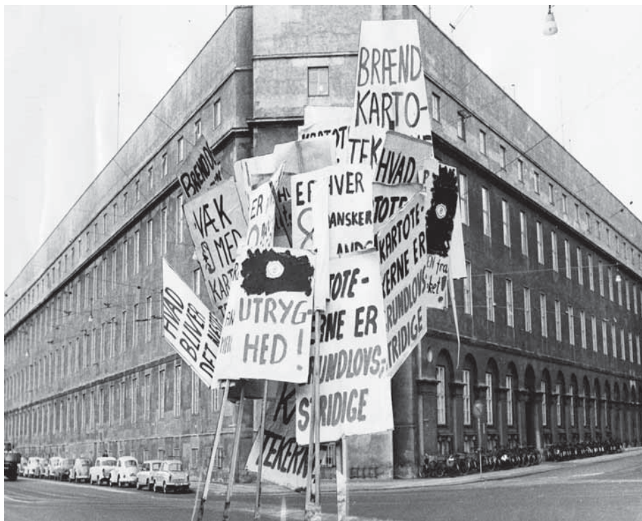
Montage fra den store kartoteksdebat i 1964. Bagved protestskiltene mod "de hemmelige kartoteker" ses Politigården i København, hvor PET's Centralafdeling var placeret indtil udflytningen til Hørhusvej på Amager i 1970. Det var i lokalerne på Politigården, at de omfattende makuleringer før og efter regeringserklæringen i 1968 fandt sted, og at den tilbageværende del af arkivet blev mikrofotograferet i 1969-70.

Tidligt i januar 1964 modtog justitsminister Hans Hækkerup en henvendelse fra folketingsmand for SF Johannes Skræppenborg-Nielsen. Efter en samtale med Hækkerup frafaldt denne dog en tid sit ønske om at søge yderligere oplysninger