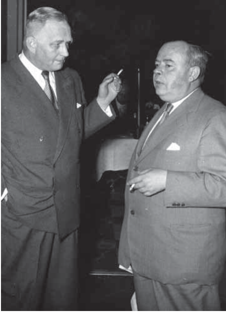
Hans Hækkerup (til højre) var cand. jur. og socialdemokratisk folketingspolitiker. Han var i 1953-64 justitsminister i skiftende socialdemokratiske regeringer. Han var 1964-68 indenrigsminister. Her er han i samtale med en østeuropæisk diplomat under en reception.