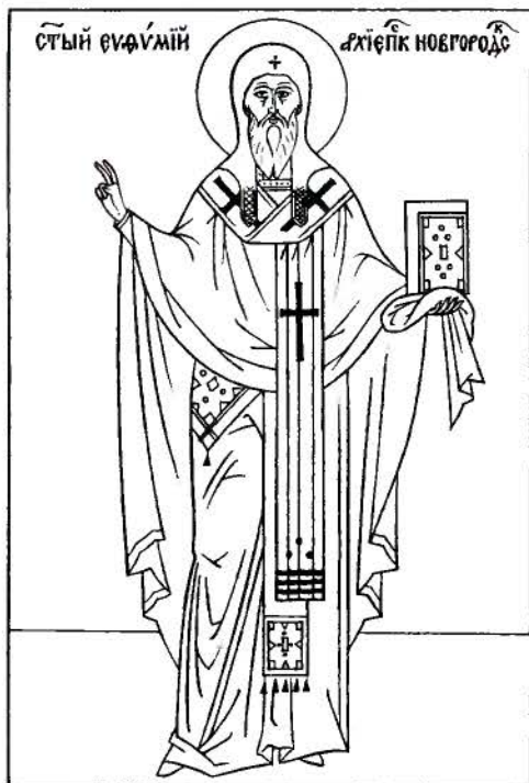
Несколько лет подвизался святой инок Евфимий в Вяжищском мона-

Достигнув пятнадцатилетнего возраста, отрок Иоанн взял родительское благословение и присоединился (не ранее 1411 года) к четырем инокам, основавшим незадолго до того обитель в урочище Вяжище (Вежище) в окрестностях Новгорода. Игумен обители Пахомий, который был прозорливым, с радостью принял нового инока, посланного Богом, и постриг его с именем Евфимий.