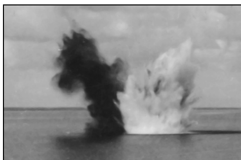
Abb. 2 und 3: Unterwasserdetonationen mit ihren unterschiedlichen Ausprägungen über der Wasseroberfläche.

nitionsverseucht (siehe Karte, Abb. 1). Vor kurzem wurde südlich der Insel Neuwerk auf einer über 10 Quadratkilometer großen Fläche besonders viel und größtenteils scharfe Weltkriegsmunition gefunden. Es handelt sich hierbei wahrscheinlich um das Hauptzielgebiet des ehemaligen Schießplatzes. Ein Großteil der Munition ist dort wahrscheinlich aber auch wild verklappt worden. Zum Schutz der Wattwanderer wurde sofort