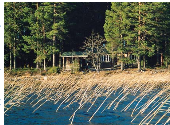
Autiotupa ja savusauna salmelta päin katsottuna.

nempi saarensoikio. Oikealle, länteen ja lounaaseen, avautuu mahtava Lentua.