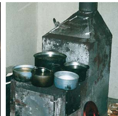
Kamiina kelpaa sekä lämmittämiseen että ruuanlaittoon.

Pieni epätoivo piristi kummasti, ja nousin lämmittämään. Kello olikin vasta vähän yli yksi. Torjuin sudenhetken kynttilöillä ja norjalaisen Håkan Nesserin pitkäpiimäisellä dekkarilla. Aivan ylimainostettu kirjailija.