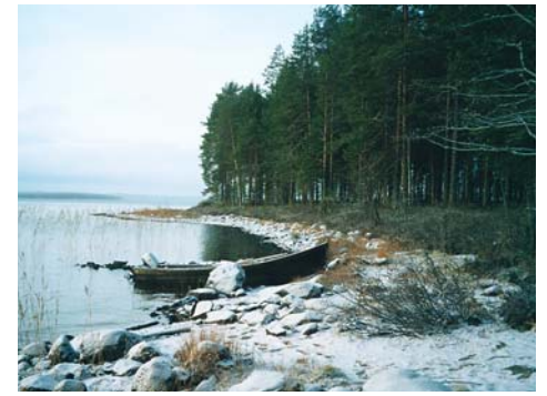
Ensi lumi satoi Lehtosaareen aamuyöllä 18. lokakuuta.

tokuvasta: pyöreä, jämällä kuoppaleuka, pitkä nenä, suu juuri ja juuri taipumassa ironiseen hymyyn. Arvoituksellisten silmien alla on moninkertaiset juonteet. Kristus-vauva on pieni, vakava vanhus.