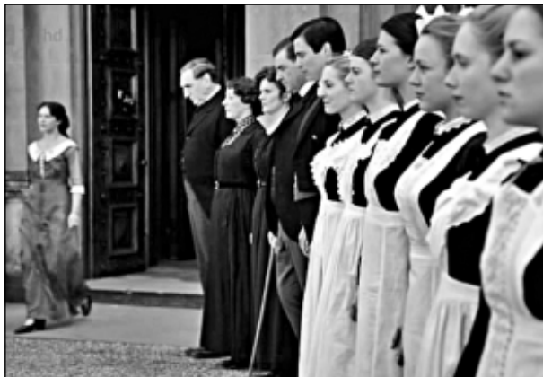
«Слуга народа» - всё же не прислуга