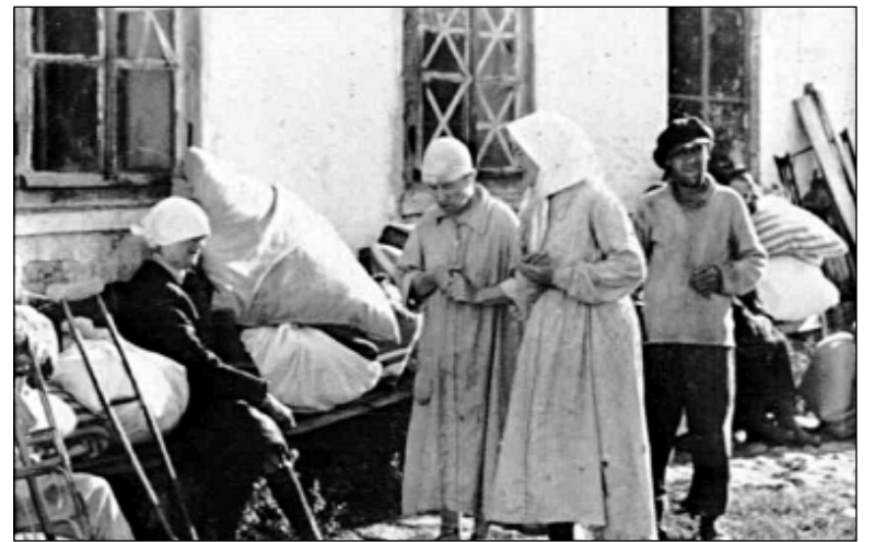
Психиатрическая больница в Колмове

Паника захватила людей в свои цепкие лапы и... понесла. Без мысли, без рассуждения, поднялись, подхватили узлы и бросились через мост, на Торговую сторону, где почему-то казалось была ещё власть, которая обязана и может указать путь, куда бежать и где спастись. Это был психоз, тот массовый роковой психоз, который в переполненном здании при одном только крике: пожар! приводит к бесчисленным жертвам давящих друг друга, безумных от страха, людей. Люди бежали и падали, бросали