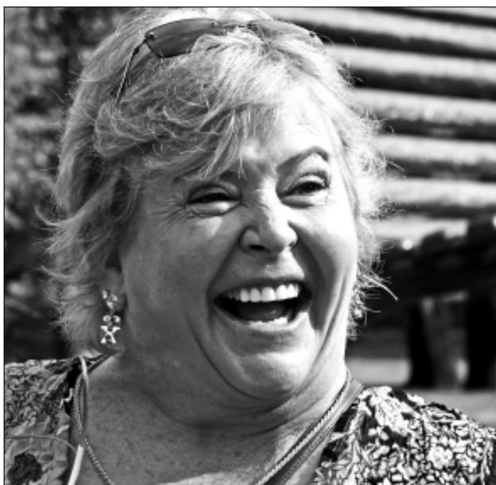
Натали Ванамейкер Хавьер