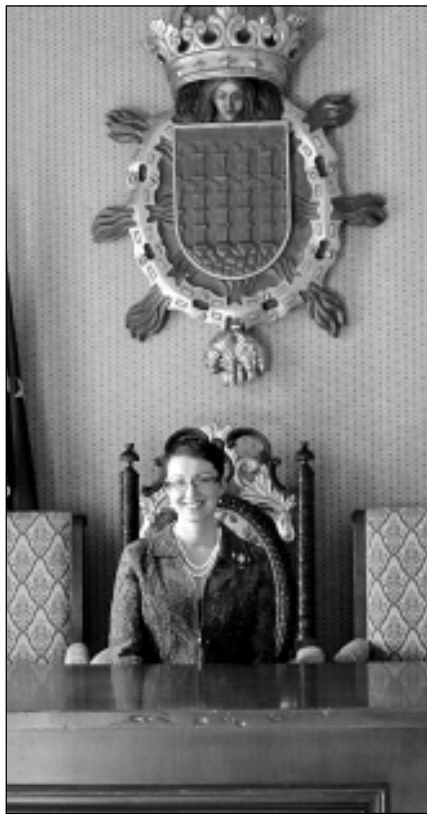
Автор осваивает кресло мэра. Правда, испанского.

В Конституции России заявлено, что мы федеративная страна. Эксперименты с федерализмом как инструментом если и ведутся федеральным центром, то в формате наращивания числа субъектов даже за счёт сопредельных государств (Крым). Для Ленобласти, скобарей (Псков) и новгородцев тема федерализма регулярно актуализируется в жанре пугалки: а не укрупнить ли нам их в единый субъект а*ля Невский или Чудской край. Не пугайтесь. Тренда на объединение регионов сейчас нет: это противоречит необходимой Москве процедуре размывания региональной власти. Централизация власти и крупных территорий в руках регио-