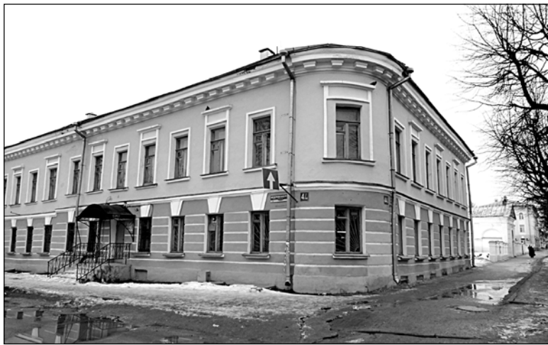
Дом Кобызского по-прежнему примыкает к церковной оградке

щую, скинул с себя пальто, оставив его на дровах. Продолав короткий отрезок пути по водосточной трубе, он добрался до карниза большого окна. Затем выдал наружное стекло рукой, вероятно поранив локоть. Внутреннее, более толстое, стекло преступник разбил ногой, после чего через проём забрался внутрь собора. Согласно сообщениям из газет, сторожа в ту ночь были пьяны. С правой стороны амвона на особом аналое стояла в киоте икона Спаса Нерукотворного. Констанский снял образ Спасителя с аналоя и положил его на клирос. Потом, сорвав пелену с соседнего аналоя, накрыл его стеклом киота и выдал его коленом. По словам грабителя, ему довольно легко удалось выдернуть из ризы золотой венчик