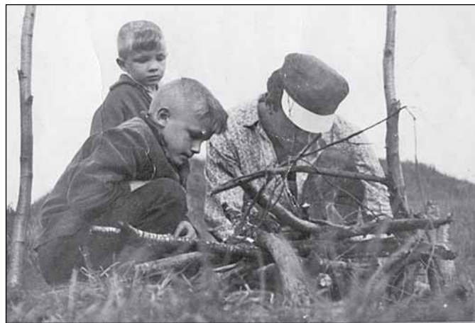
«Еграши»: автор с отцом и братом на рыбалке. Далёкие семидесятые, Старорусский район

Звенят подлецы – то с угрозой, то сладко, Куда-то меня повернуть норовят, Поставить в свой серый, обыденный ряд, Но всё, доложу вам, в порядке! «Подъём, Еграшок, на том свете доспим!» – Я сыну поглажу чумазую пятку, – «А ну-ка, скорее вылезай из палатки!» Пусть это покажется глупой повадкой, Я должен быть неумолим.