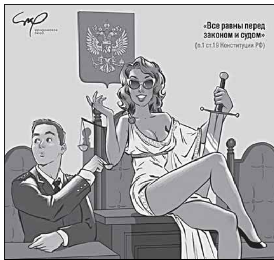
Из «Конституционного календаря на 2015 г.» художника А. Тарусова

зывает правомерность принятия судом к производству запроса о проверке Договора и возможность рассмотрения этого дела вообще. Статья 36 Федерально-го конституционного закона «О Конституционном Суде Российской Федерации» (далее Закон «О Конституционном Суде») предусматривает только одно основание к рассмотрению дела, ко-