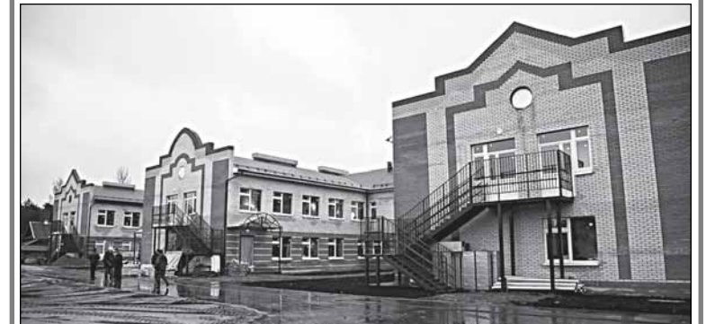
Хвойная, детский сад №1 на 240 мест. Стоимость работ - 129,3 млн. руб., в том числе из федерального бюджета - 65,8 млн.

- А когда оборудование подойдёт? - интересуются губернатор. - На следующей неделе? И тёплые полы на первом этаже уже готовы? Хорошо... Такой садик украсил бы и Новгород, да и Москву, пожалуй... Непросто шло строительство, пришлось ООО «Новгородсельстрой» подключить, нашу «палочку-выручалочку», и теперь степень готовности - высокая. Общестроительные работы до конца года закончатся, и месяца через два можно приводить детей. И очереди в Хвойной уже не будет.