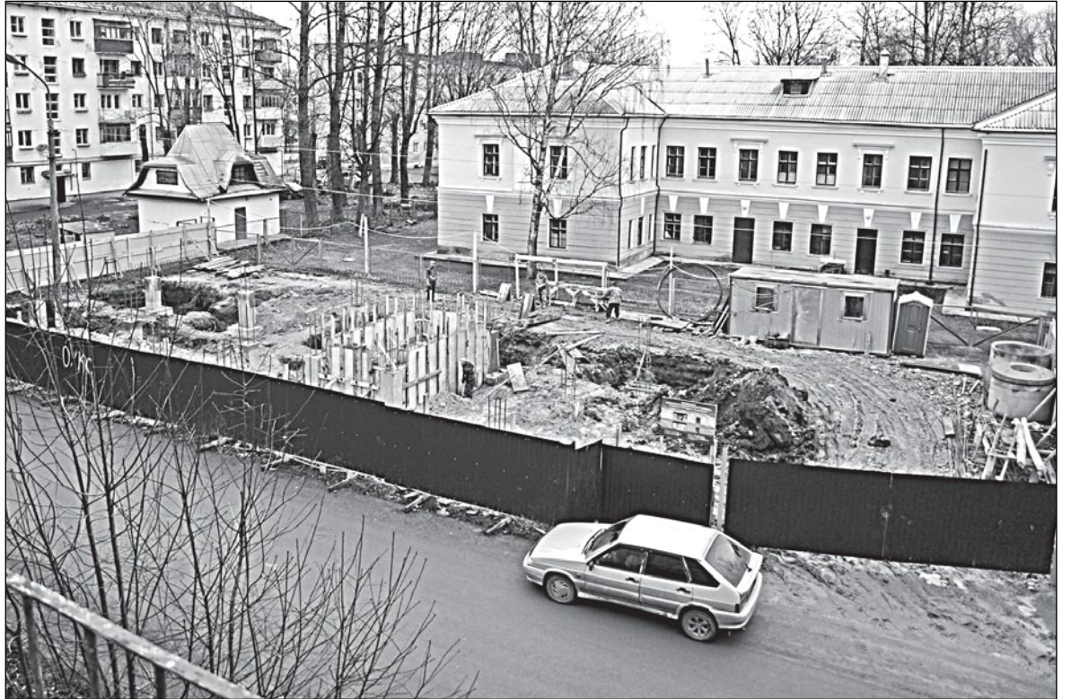
Если бы контролирующие инстанции когда-нибудь проинспектировали стройку, они узнали бы, что днём здесь работают без касок. Но поскольку объект не проверяют и днём, то ночью можно без опаски включать шумный дизель под самыми окнами

2. Правоммерно ли выдано разрешение на строительство ФОКа по улице Локомотивная, учитывая также, что это здание буквально втискивается на небольшой земельный участок между домом № 7 по Воскресенскому бульвару и зданием железнодорожной поликлиники, расстояние между которыми составляет приблизительно 40 метров? Соблюдаются ли при этом требования Федерального закона «О санитарно-эпидемиологическом