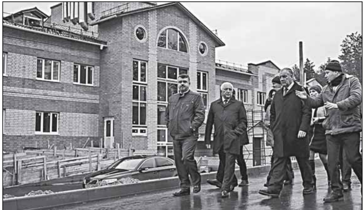
Любытино, поликлиника, стоимость общестроительных работ - 139,9 млн. руб.