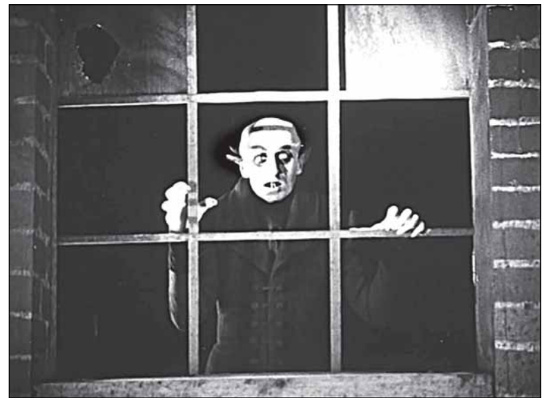
Кадр из фильма Ф. Мурнау «Носферату»

Совершенно неясно, зачем нужна была вся эта буффонада перед