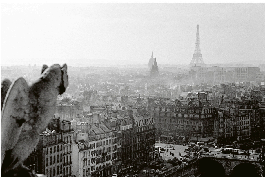
Näkymä Notre-Damen tornista vuonna 1954.

He löysivät leirintäalueen, todennäköisesti Boulognen puustosta, ja pääsivät johonkin teltaan yöksi.