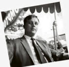
Nuori Sorsa Pariisissa.