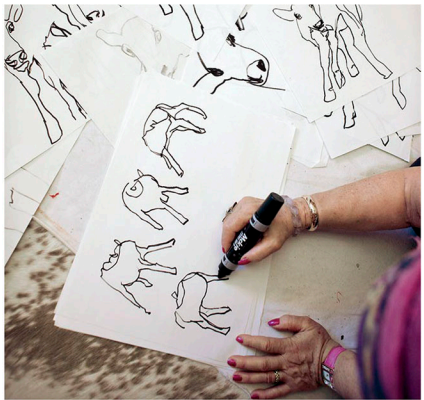
Vasikan hahmo on Miina Äkkijyrkällä hullussa.