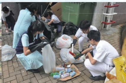
玻璃大使培訓(析廢師活動)