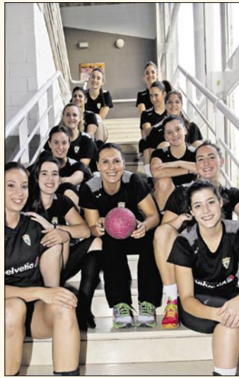
Las chicas del Alcobendas.