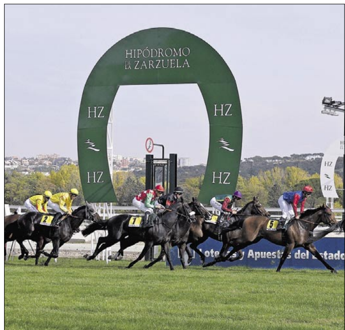
EMOCIÓN. Primer paso por meta del último GP de Madrid.

El Fuenlabrada cuida a su cantera en todos los aspectos. Por eso ya está en marcha su Campus Urbano, destinado a chicos y chicas de 6 a 14 años y que se celebrará en el pabellón El Arroyo. Habrá tres turnos, uno que concluye hoy, otro del 27 de junio al 1 de julio y el tercero, del 4 al 8 de julio. Las clases durarán desde las 8:50 hasta las 18:00 y las inscripciones se pueden realizar en las oficinas del Baloncesto Fuenlabrada.