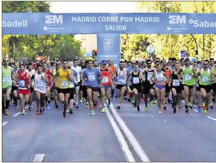
2015. La salida de Madrid corre por Madrid del año pasado.

pueden hacer en la sede de MAPOMA y a través de la página web de la carrera. La cita volverá a contar con el apoyo del Banc Sabadell y con los más de 10.000 runners que se reúnen en esta prueba que abre el calendario de carreras populares de otoño en la Comunidad. Madrid corre por Madrid ya es un clásico del atletismo popular.