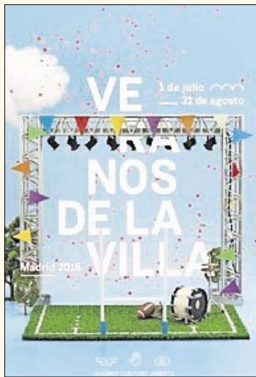
El cartel del torneo.