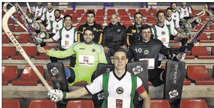
FOTO DE EQUIPO. La plantilla del Club Patín de Alcobendas.

Para el Villaverde, el ascenso es toda una experiencia en su modelo, que se fundamenta en el trabajo de cantera, con jugadoras prácticamente aficionadas y formadas desde los estratos inferiores. Saldrá en la División de Honor porque los 30.000 euros de más que cuesta la categoría los puede asumir directamente con el trabajo de los socios, aunque desde la dirección se esfuerzan para lograr "el doble al menos, para dar una estabilidad