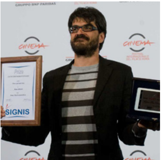
Roan Johnson per Fino a qui tutto bene (2014)