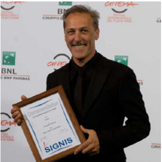
Marcello Mazzarella per Biagio (2014), di Pasquale Scimeca