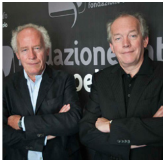
Jean-Pierre e Luc Dardenne

The “Robert Bresson” Award, created in 1999, is assigned by the Fondazione Ente dello Spettacolo and by the «Rivista del Cinematografo» during the Venice Film Festival, in accordance with the Pontifical Councils for Culture and Social Communications. The “Robert Bresson” Award is given every year to a director that has provided a significant artistic testimony of the difficult journey in search of the spiritual meaning of life. In the previous years, this Award was assigned to: Giuseppe Tornatore, Manoel de Oliveira, Theo Angelopoulos, Krzysztof Zanussi, Wim Wenders, Zhang Yuan, Walter Salles, Aleksandr Sokurov, Jean-Pierre and Luc Dardenne, Ken Loach, Amos Gitai and Carlo Verdone.