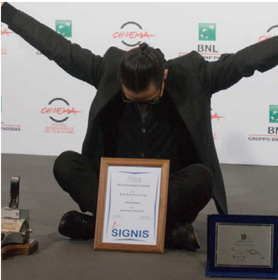
Burhan Qurbani per We Are Young. We Are Strong (2014)

Since 2014 SIGNIS (Signis.net), the International Catholic organization for communication, is present in the Rome Film Festival with its own international jury, in partnership with Fondazione Ente dello Spettacolo, to assign the special prize "SIGNIS Award - Ente dello Spettacolo", a monetary award of five-thousand Euros. This is an important collaboration as SIGNIS (also operating in the sectors of radio, television, film, video and media education) favours concretely and fruitfully to the development of a cinema that promotes the human and spiritual values.