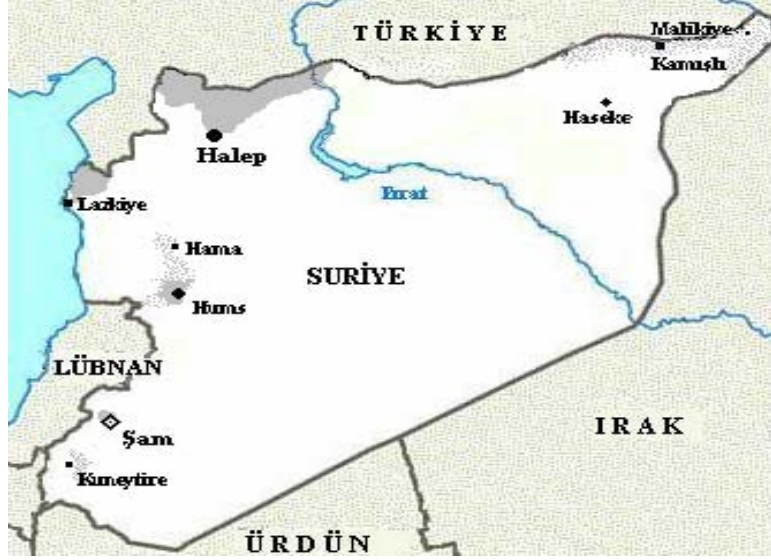
Harita 2: SURİYE'DEKİ TÜRKLERİN YAŞADIĞI YERLER

Not: Yukarıdaki harita, yazar tarafından hazırlanmıştır. Harita hazırlanırken yazarın Ağustos 2003'te bölgeye yaptığı seyahate ek olarak şu kaynaklardan faydalanılmıştır: Öztürk, 'Suriye Türkleri' ve Şandır, 'Suriye Türklüğü'.