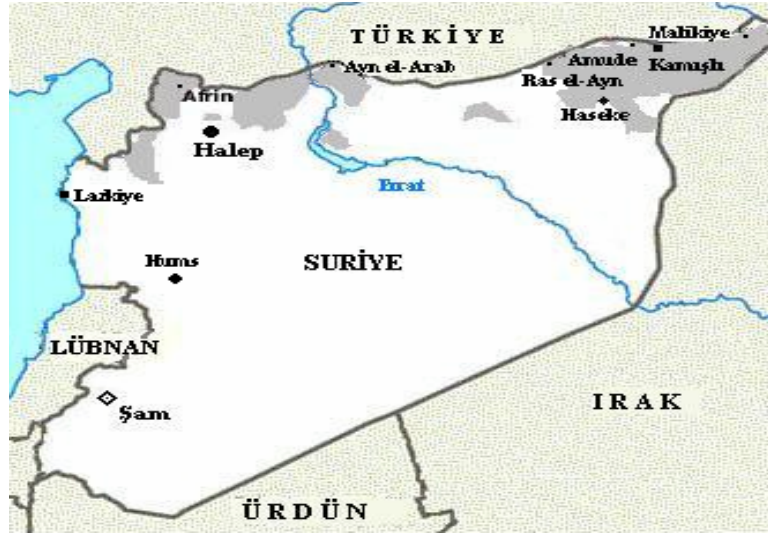
Harita 1: SURİYE'DEKİ KÜRTLERİN YAŞADIĞI YERLER