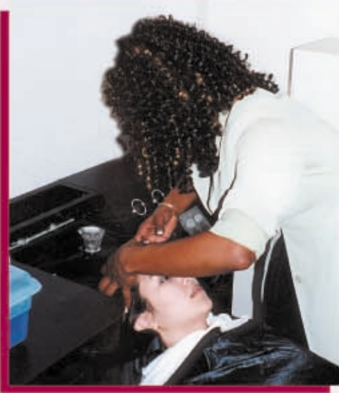
Evite inclinarse sobre el lavabo del champú

Piense en la ergonomía - adecuando la tarea a la capacidad de la persona Para empresas pequeñas - Cosmetología