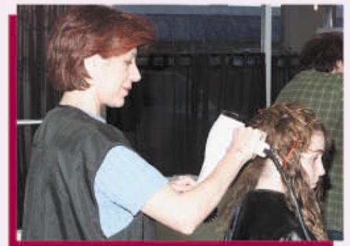
Cambie la manera de agarrar la secadora y ajuste la altura de la silla para mantener los brazos a los lados de su cuerpo