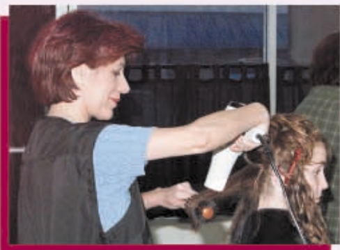
Evite elevar sus codos

MANTENGA SUS BRAZOS A LOS LADOS DEL CUERPO