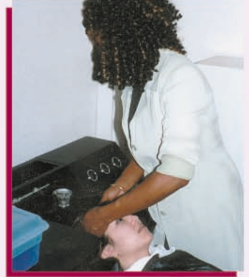
Acérquese más y colóquese de cara al cliente