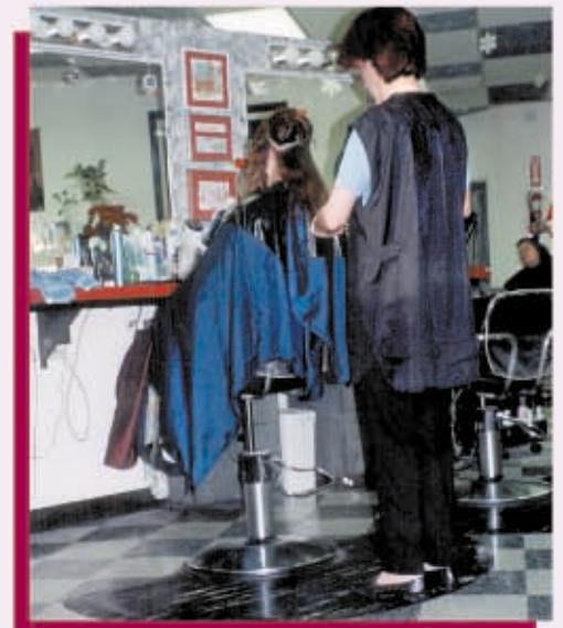
Manténgase erguida, ajuste la altura de la silla