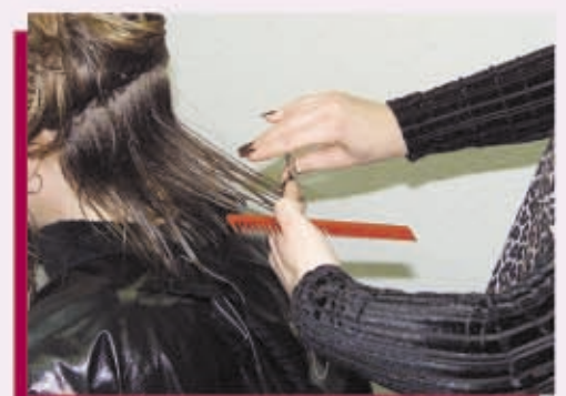
Posicione sus manos palma a palma y use tijeras apropiadas