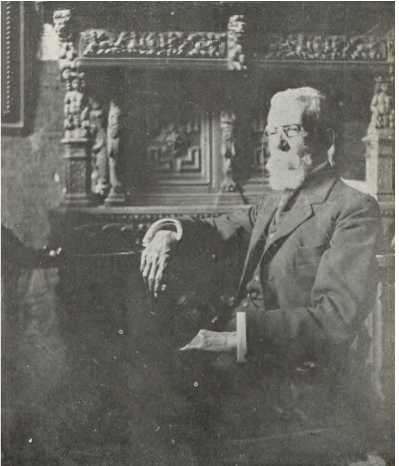
Machado de Assis em fotografia de 1905.