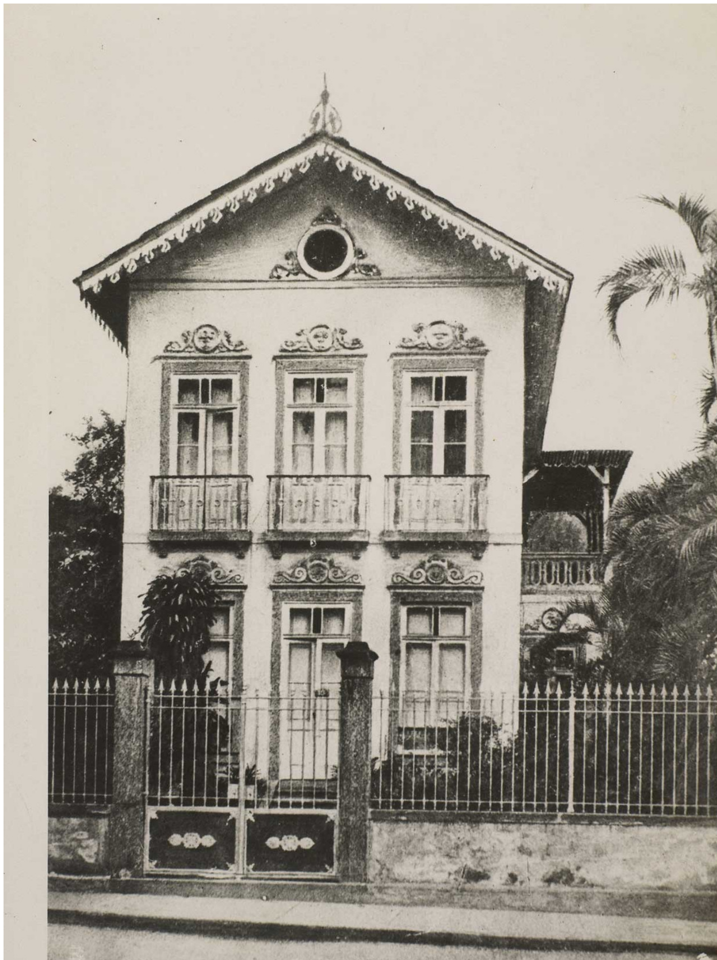
Casa em que faleceu o escritor Machado de Assis