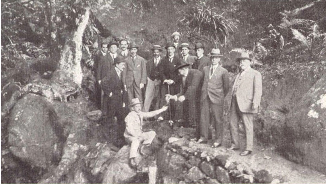
Olavo Bilac acompanhado de jornalistas em visita à Serra da Cantareira. Fotografia publicada na revista "A Cigarra", edição de 1914, disponível no site do Acervo Público do Estado de São Paulo