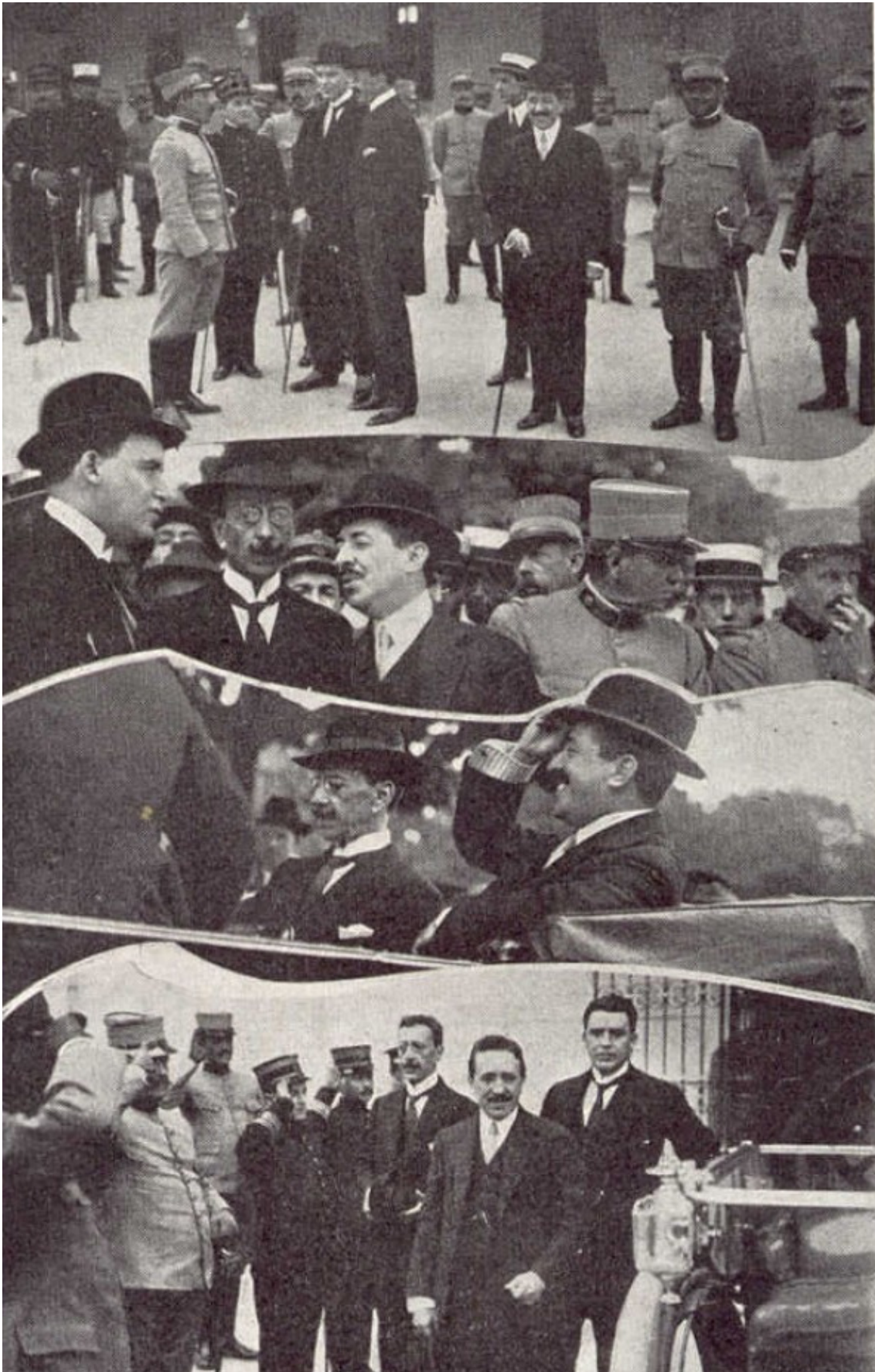
Bilac visitando a Força Pública do Estado de São Paulo, em 1917. Fotografia publicada na revista "A Cigarra", disponível no site do Acervo Público do Estado de São Paulo