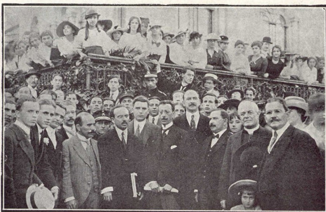
Grupo photographado para "A Cigarra", por ocasião da visita de Olavo Bilac à Escola Normal da Praça da Republica, onde o poeta foi entusiasmamente aclamado pela mocidade.