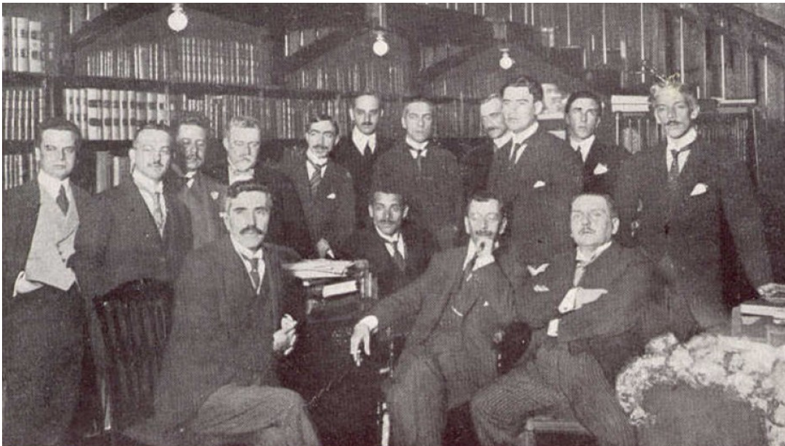
Olavo Bilac em companhia de Júlio Mesquita e Alfredo Pujol, entre outros. Fotografia publicada na revista "A Cigarra", edição de 1914, disponível no site do Acervo Público do Estado de São Paulo