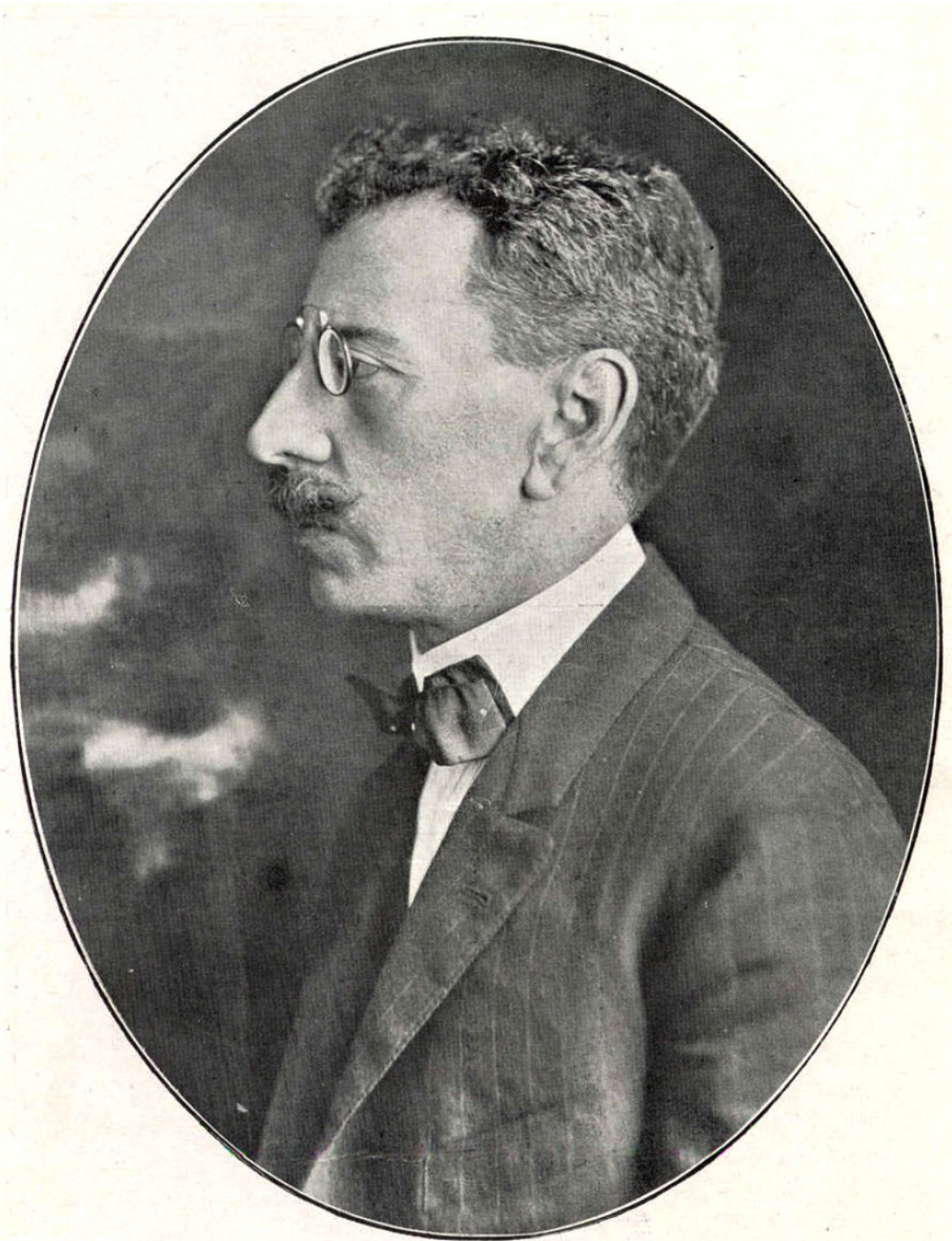
O ÚLTIMO RETRATO DE OLAVO BILAC, O GRANDE POETA BRASILEIRO, DENODADO CAMPEÃO DO NACIONALISMO, RECENTEMENTE FALLECIDO NO RIO DE JANEIRO

Fotografia de Olavo Bilac, publicada na revista "A Cigarra", em 1919, logo após seu falecimento. Bilac sempre foi considerado em grande nacionalista.