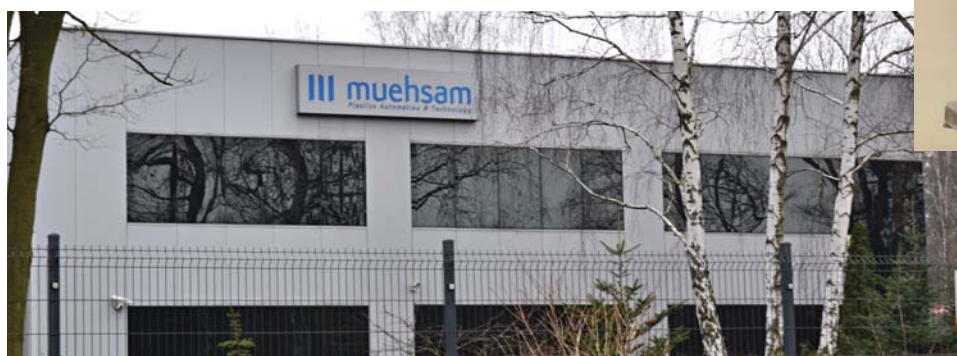
Siedziba firmy w Międzylesiu, z prawej dawniej produkowany młynek do mielenia kawy w sklepach