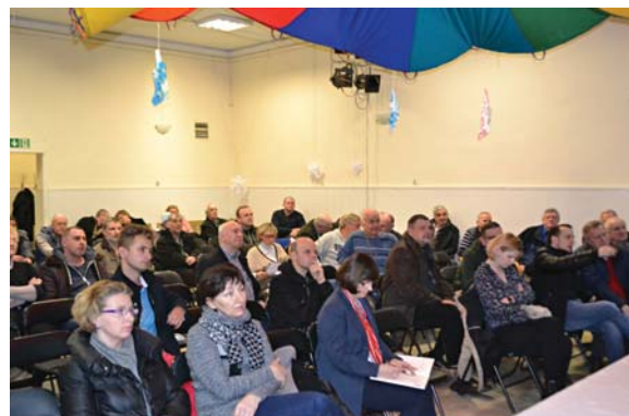
Mieszkańcy Aleksandrowa i Zbójnej Góry od lat czekają na rozwiązanie problemu podtapiania posesji

Największy problem stwarza okolica skrzyżowania ul. Napoleona Bonaparte z jej skrzyżowaniem z ul. Podkowy. Stąd trzeba by było przepompowywać wodę gdyż nie ma ona możliwości spłynięcia samodzielnie.