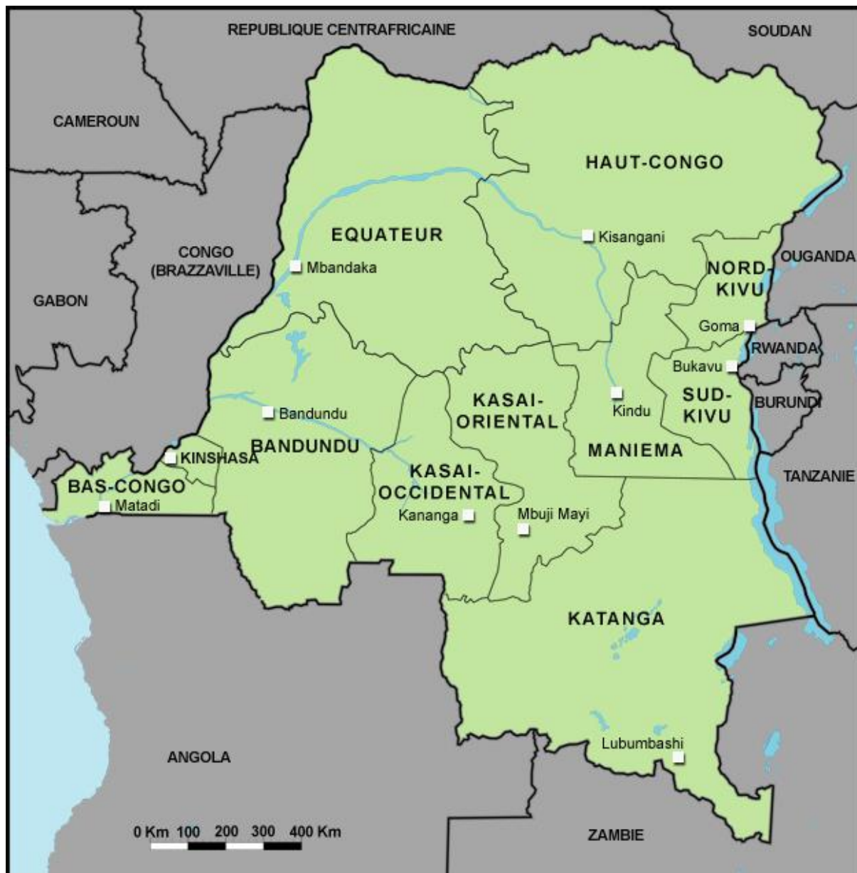
Graphique 1.1 : Carte de la République démocratique de Congo en onze provinces

La République démocratique du Congo (RDC) est un pays situé en Afrique centrale, sur l'équateur et est compris entre 5° latitude nord et 13° latitude Sud. La superficie de la RDC est de 2 345 095 km 2 1 . Il compte 9 165 km de frontières qu'il partage avec 9 pays, à savoir : la République du Congo et l'enclave de Cabinda (Angola) à l'Ouest ; la République Centre Africaine et le Soudan au Nord ; le Rwanda, la Tanzanie, l'Ouganda et le Burundi à l'Est ; la Zambie au Sud-est et l'Angola au Sud.